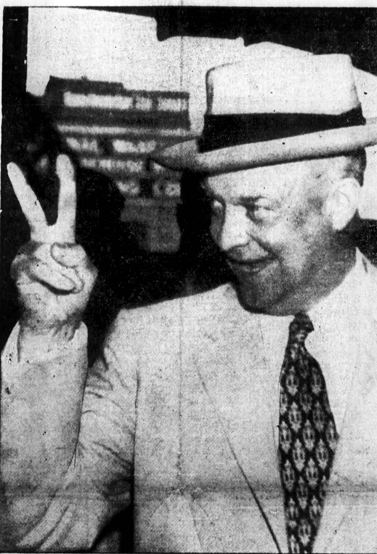
Laimėjimo ženkla rodydamas, gen. Eisenhoweris sutiko nominacijos žinią.