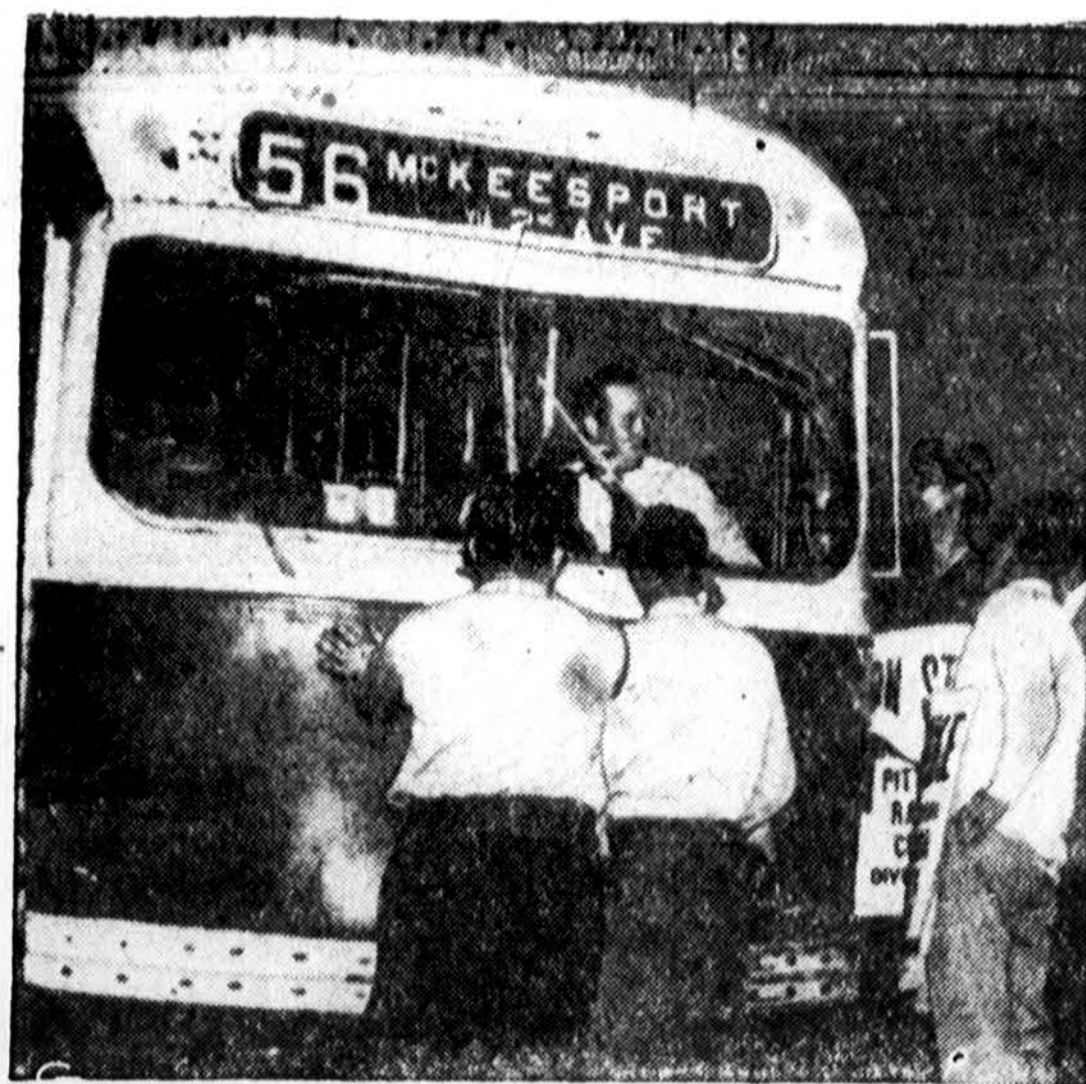
Pikietuotojai sulaukė gatvėkarį Pittsburgh, Pa., kai vairuotojai pradėjo streiką.