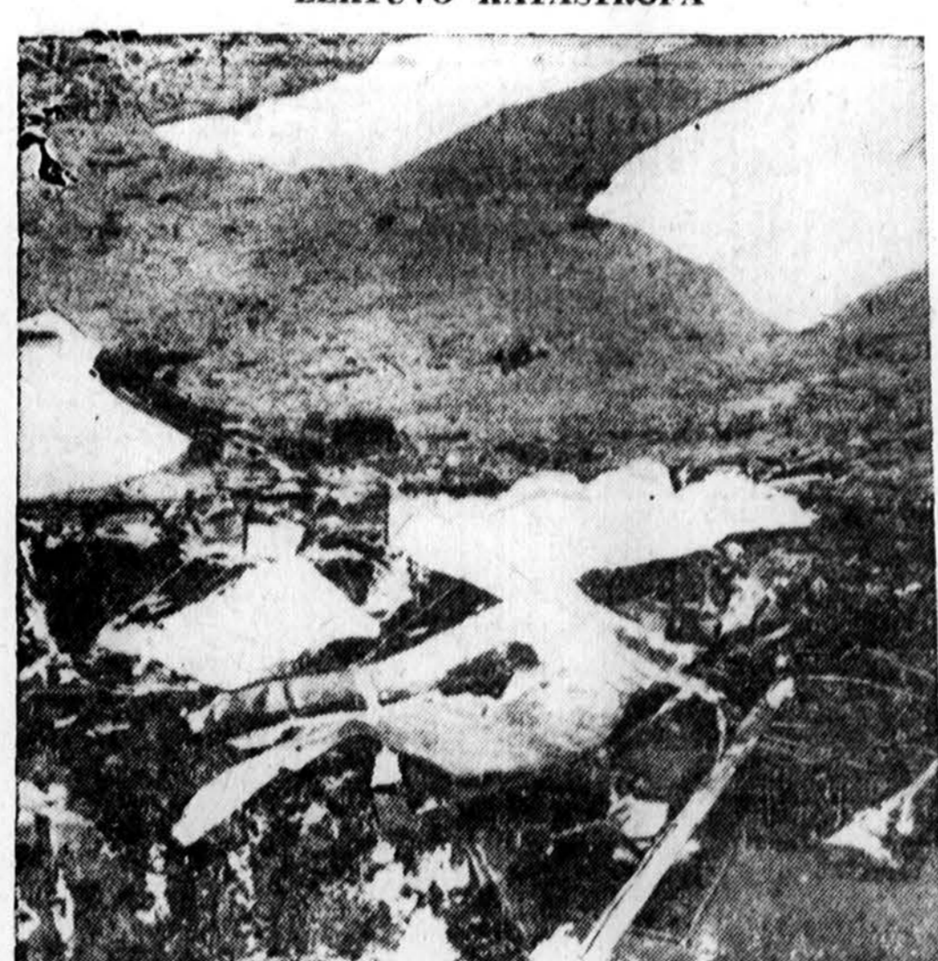
B-47 bombonešys sprogo virš Mariana, Fla. Lektuvo likanai matosi ant žemės. Keturi įgulos nariai žuvo ir du vaikai mirė apdegę.