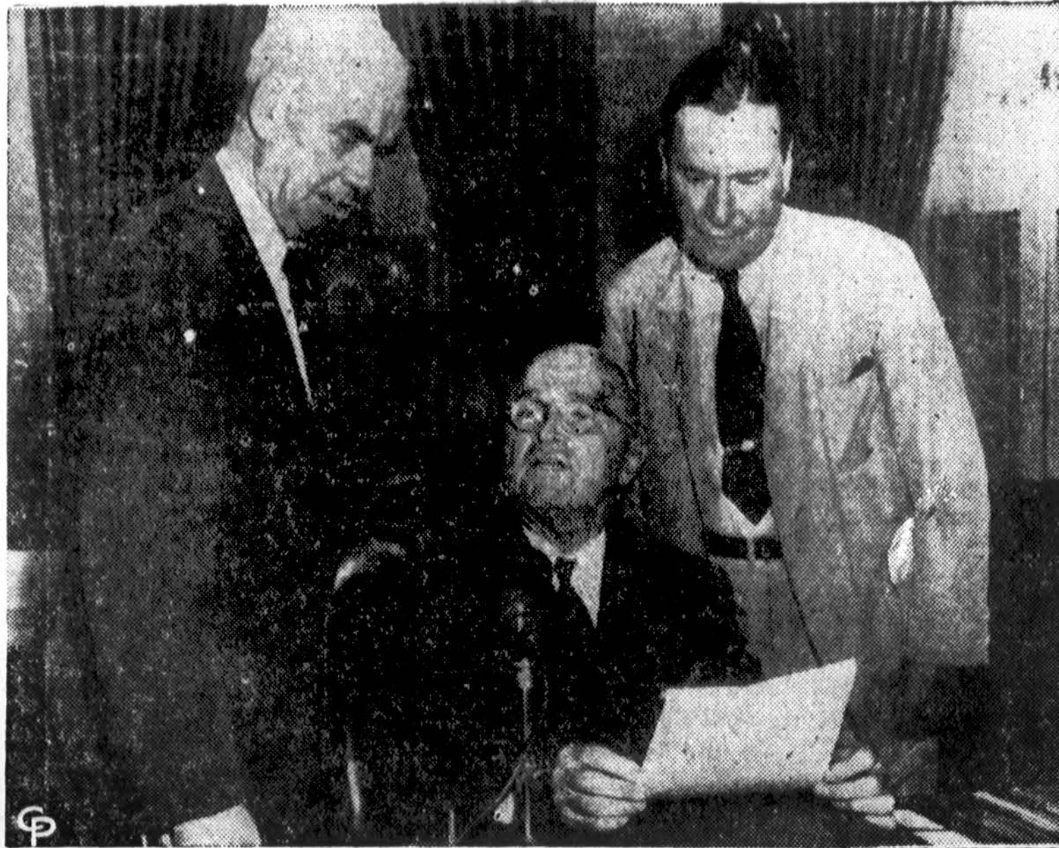
Prezidentas Trumanas praneša spaudai, kad plieno bendrovės galop susitarė dėl naujos darbo sutarties ir fabriky kroznys vėl bus užkurtos. Prezidentui darant pranešimą, prie jo stovėjo CIO pieno darbininkų unijos pirmininkas Murray (kairėje) ir U. S. Steel pirmininkas B. Fairless. Prezidentas juodu pasikvietė pas save ir privertė susitarti.