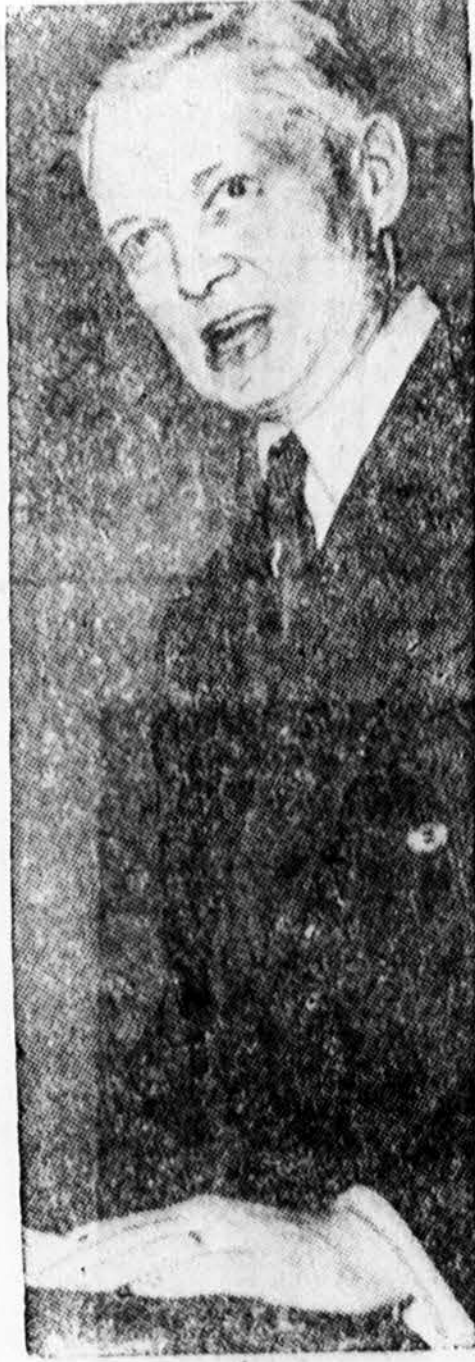
Gubernatorius Sherman Adams, iš New Hampshire, yra generolo Eisenhowerio prezidentinės kampanijos štabo viršininkas.