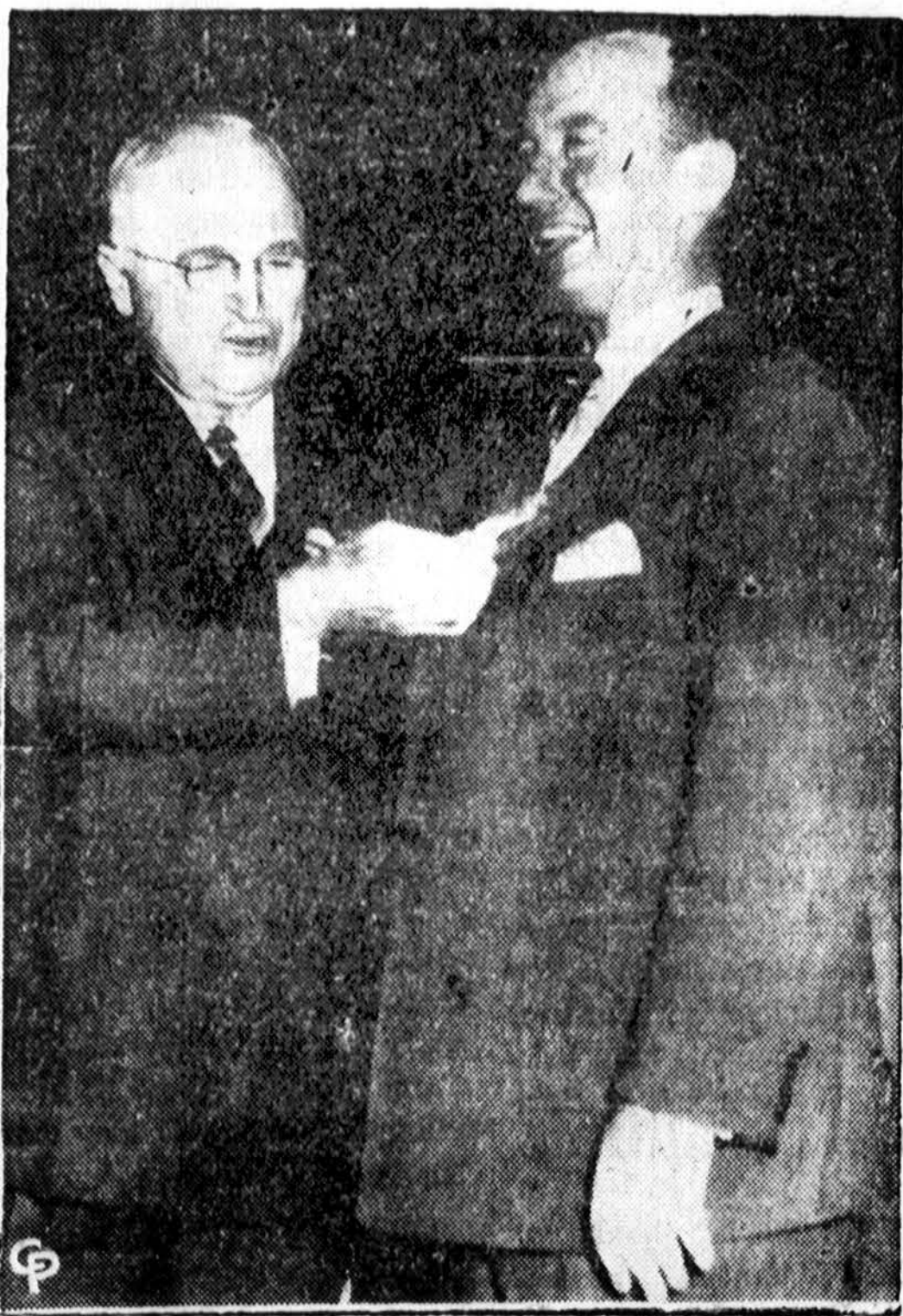
Prezidentas Trumanas, atskridęs iš Washington pristatyti Demokrataų partijos konvencijoje Chicagoje Demokrataų prezidentinio kandidata Stevenson, sega kaspiną prie jo krūtinės, prieš įžengiant į International Amphitheatre.