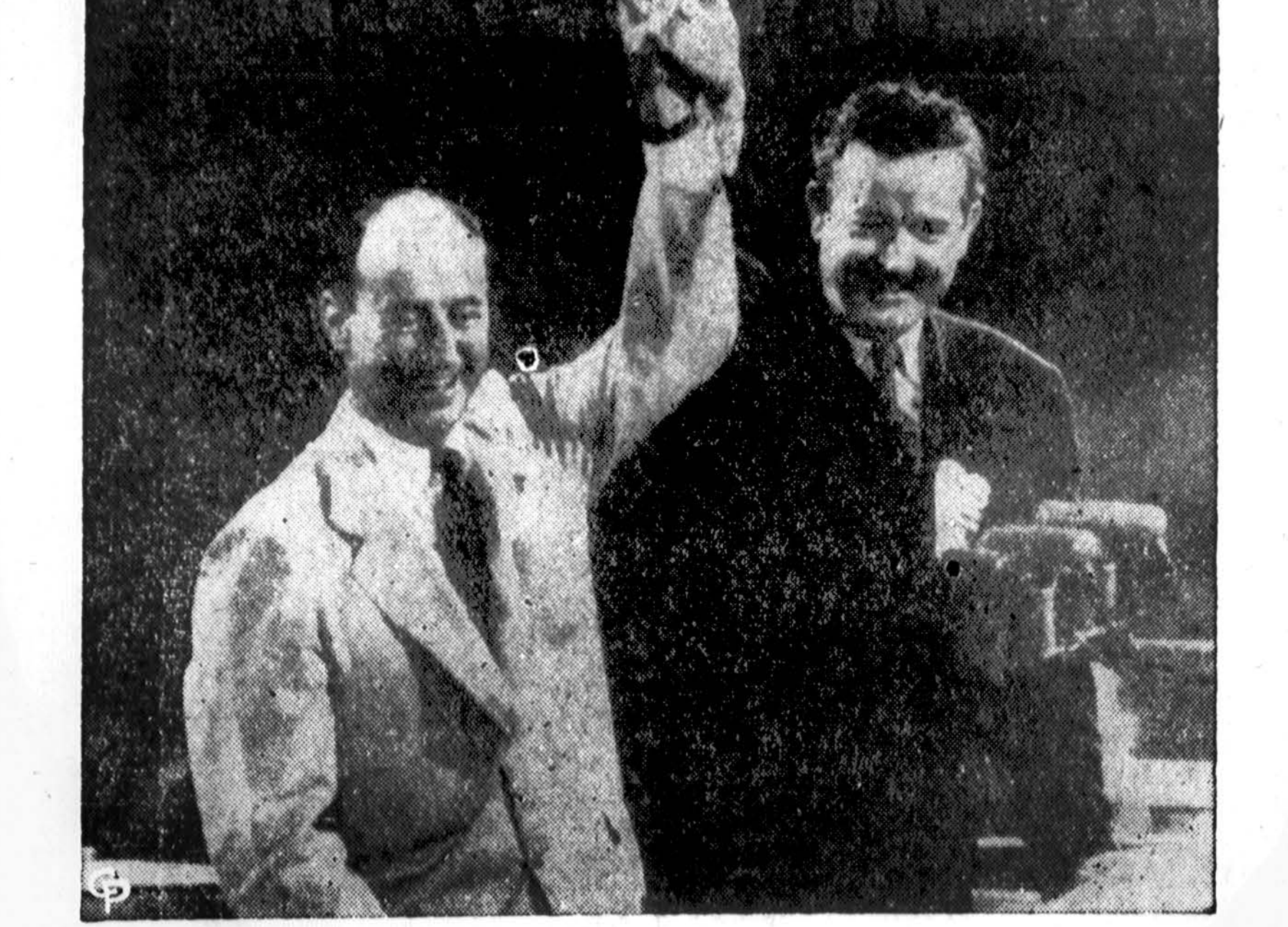
Gub. Stevenson pritaro demokratų konvencijai sen. Sparkman, pietietį iš Alabama valstybės, kuris aklimacijos būdu parinktas viceprezidento vietai. Juodu su partijos centro komitetu jau aptarė rinkiminės kampanijos strategiją.