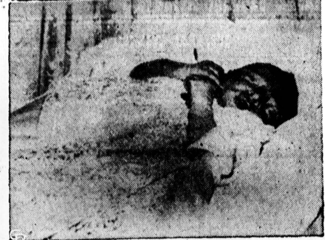
Princas Ahmed Fuad, 7 mėnesių amžiaus, Egipto karaliaus Farouko sūnus užims savo tėvo Farouko sostą, karalių nuvertus nuo sosto.