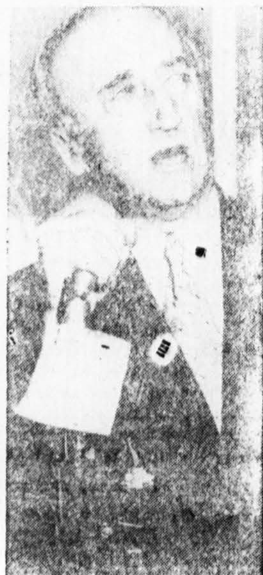
South Carolinos gub. James F. Byrnes kalbėjo Demokratų partijos konvencijoje gindamas savo delegaciją.