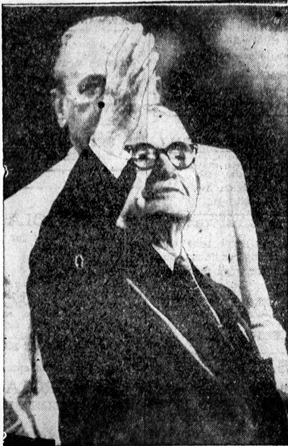
Viceprezidentas Alben Barkley sveikina Demokratų konvencijos delegatus. Barkley, senas politikas, pasakė įdomią kalbą Demokratų konvencijoje Chicagoje.

susirinkimams bei minėjimams. Tie namai buvo lenkų komunistų nuosavybė. Pasirodo, kad komunizmas pradeda bankrutuoti nuo Kanados. Duok, Dieve, kad greitai ateitų ta valanda iš mūsų tėvynėj ir visam pasaulyje.