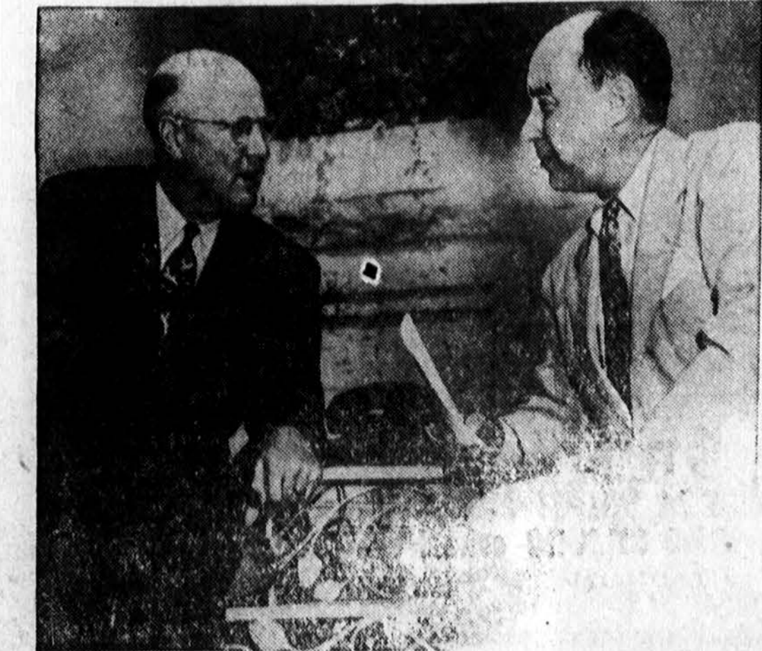
Demokratų prezidentinis nominatas A. Stevensonas tariasi su žemės ūkio sekretoriumi Brannan kaip laimėti ūkininkų balsus.

● Britai su prancūzais sutarė bendrą planą Indokinijai nuo kinų komunistų invazijos ginti.