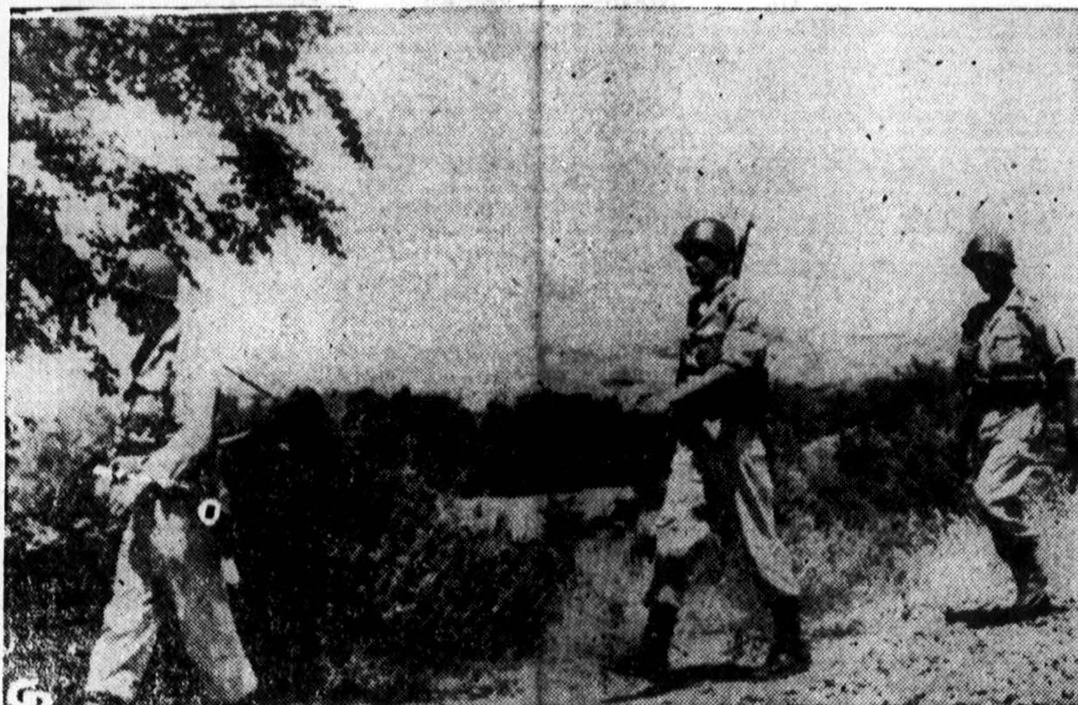
Graikijos kariai saugoja pasienį, kur vyksta šilviais remiamas ginčas su bulgarais dėl mažos salos Evros upėje. Bulgarai iš salos yra išmušę, bet ar tuo reikalas baigsis, galima tik spėlioti.