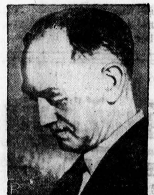
Prancūzų policija surado Alpeose nužudytą britų biochemiką Sir Jack Cecil Drummond, 61 m. amž. su jo žmona ir dukterimi Manoma, kad jis nužudė pabėgęs vyras iš svetimšalių legione.