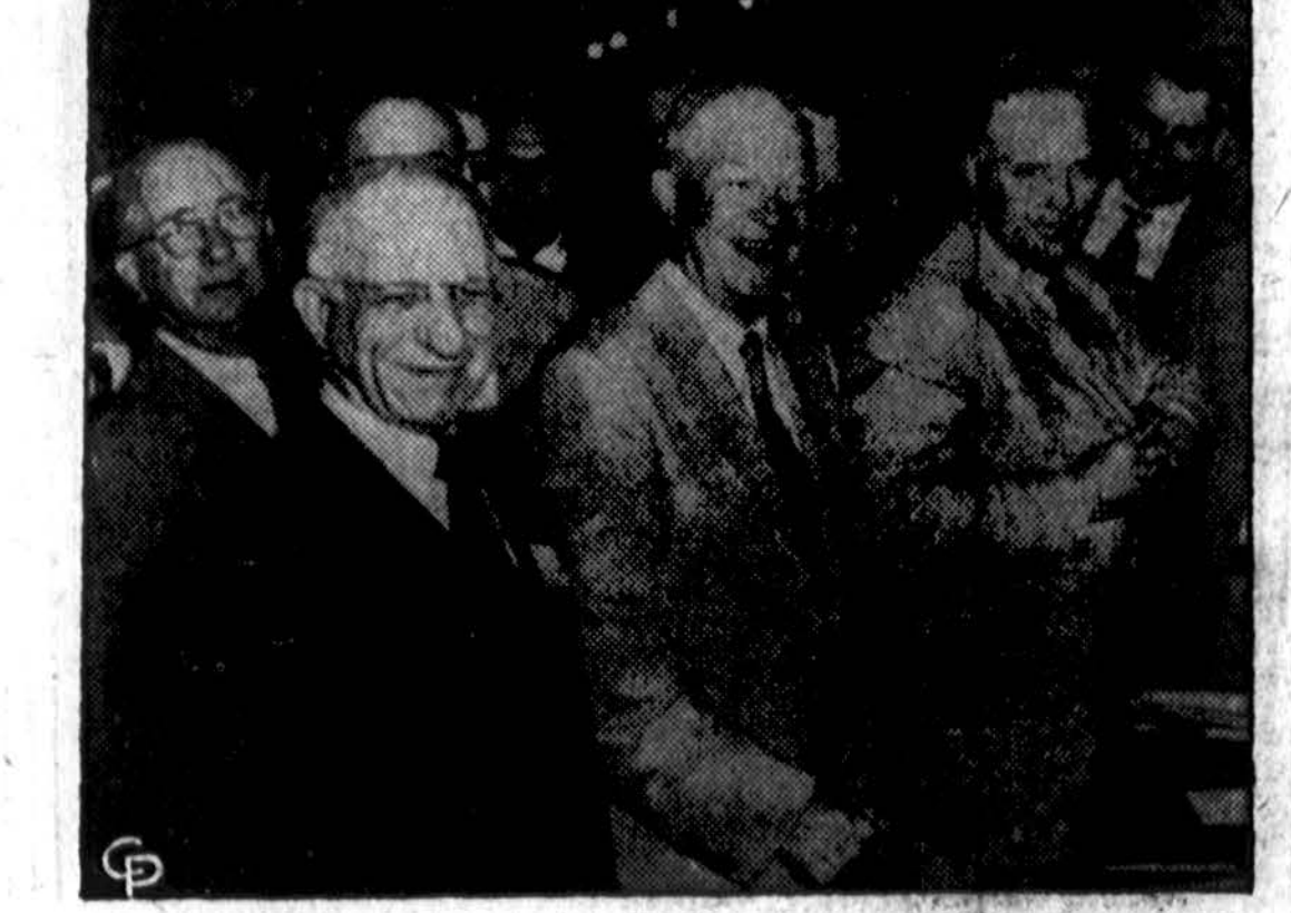
Respublikonų kandidatas į prezidentus gen. Eisenhower iš Boise, Idaho atskrido į Kansas City, Kansas. Čia jis tarėsi su centra- linių valstybių gubernatoriais apie veiklą, kad respublikonai lai- mėtų lapkričio mėnesio rinkimuose.