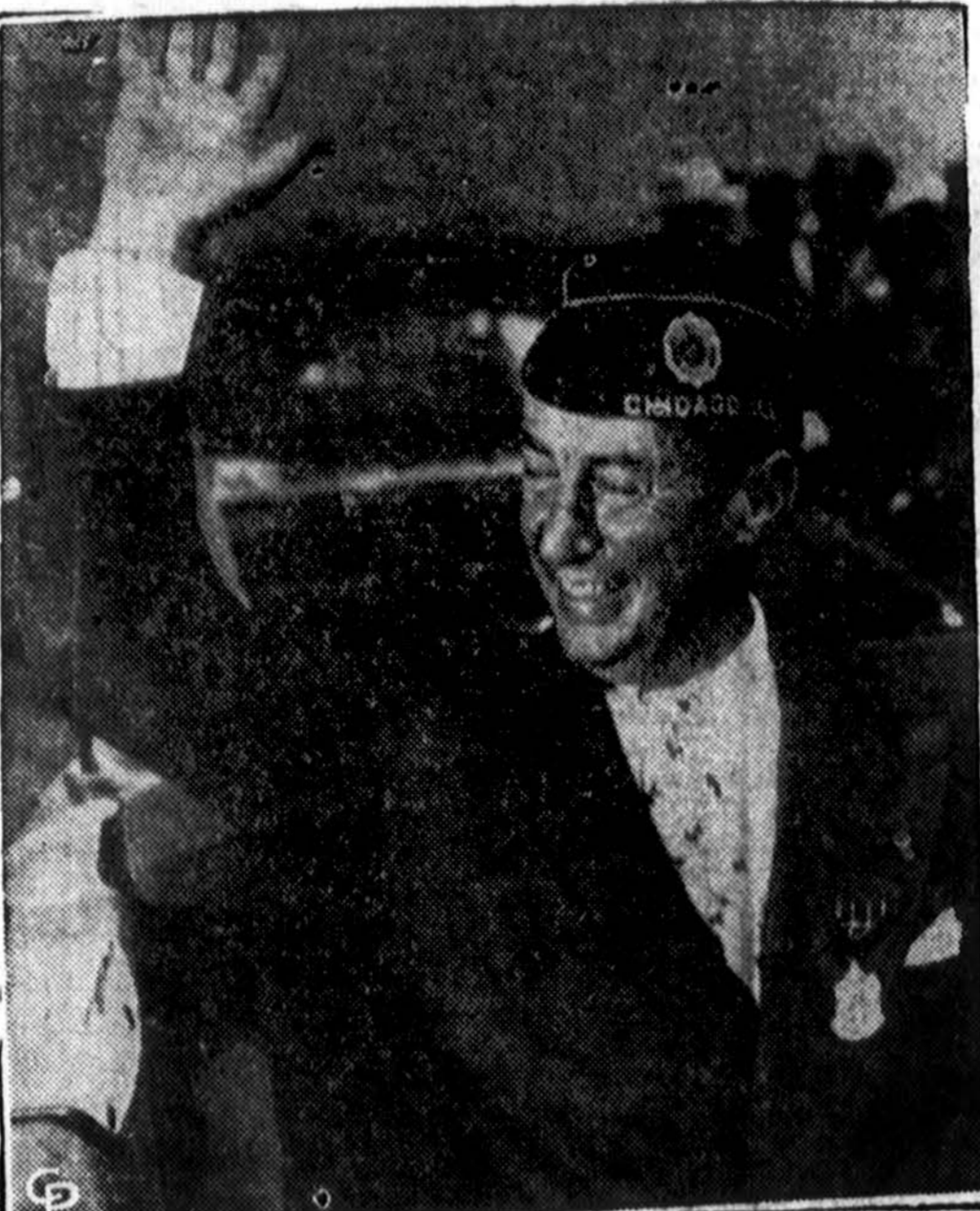
Gub. Adlai Stevenson, Demokratų partijos prezidentinis kandidatas, dėvėjęs legionierių kepuraitę, pasakė kalbą Amerikos legionierių suvažiavime New York.