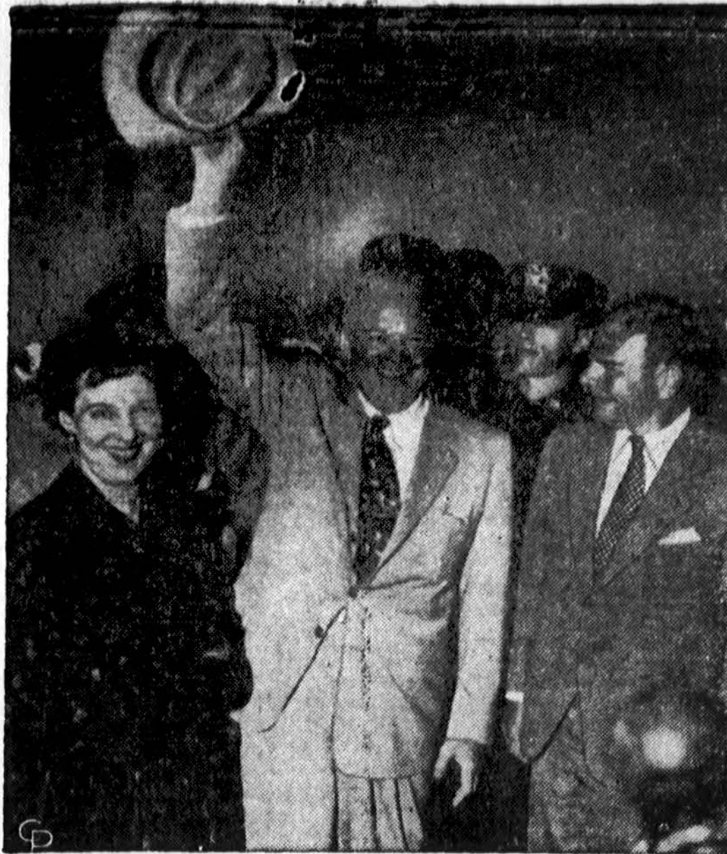
Gen. Eisenhower atvyko į New Yorką ir čia American Legion konvencijoje pasakė kalbą. Šalia jo yra jo žmona ir gub. Thomas E. Dewey.