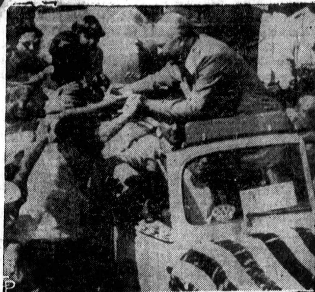
Gen. Eisenhoweris atvyksta į Indianapolį laimėti respublikonų, kurie prieš konvenciją čia buvo Tafto šalininkai. Dabar jau aišku, kad Eisenhowerio kampanijos tvarkytojai kiekviename mieste, kur Eisenhoweris atvyksta kalbos sakyti, organizuoja kandidato važinėjimą gatvėmis.

biure ir sudaro branduolį tos bolševikų grupės, kurioje, kaip tik ateis laikas, vyks tikroji kovą už Stalino sosto paveldėjimą.