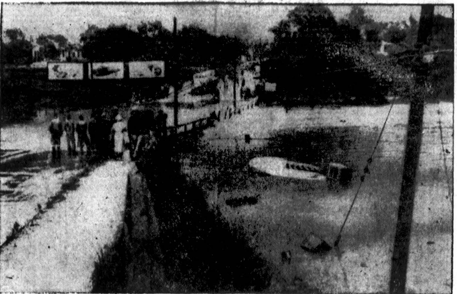
Texas valstybė po sausrų nusiaubė liūtyr ir uraganas. Čia matomas apsemtas treilerinis namelis yra tik dulkė prieš nuostolius, kuriuos patyrė aviacija savo dviejose atominėse bombas vežioji skirtose bombonešiu B-36 bazėse. Teigiama, kad daugiau ar mažiau apgadinti 107 bombonešiai ir nuostoliai gali siekti iki 50 mil. dol.