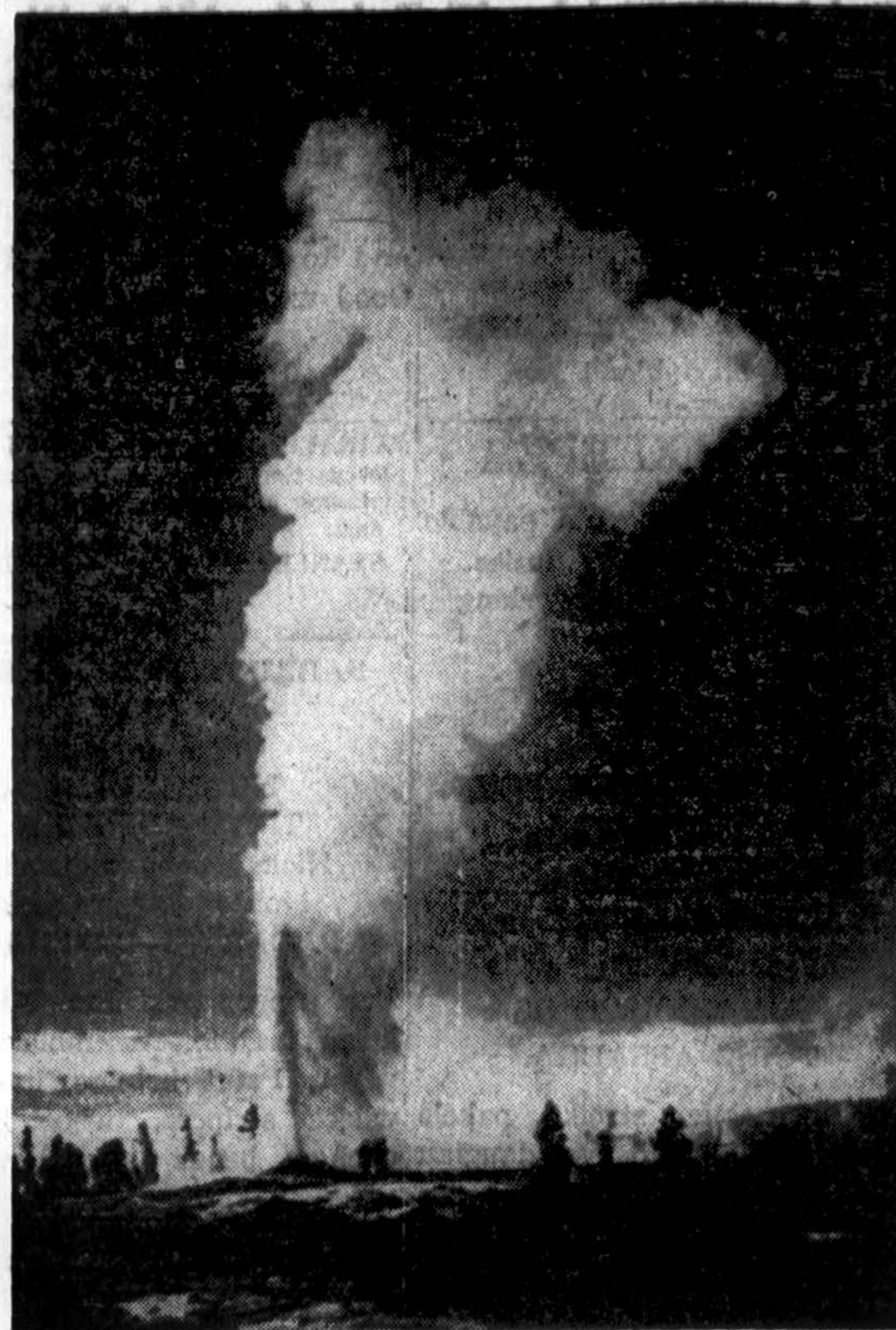
Old Faithful geizeris