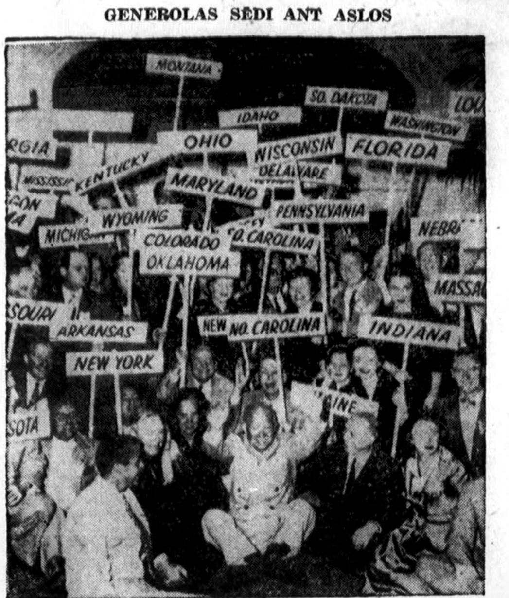
Gen. Eisenhower, respublikonų partijos kandidatas į prezidentus, po prakalbų sėdi ant aslos New Yorko Park Lake Hotelyje ir tariasi su „Citizens for Eisenhower“ organizacijos nariais, kurių tarpe yra atstovai iš visų 48 Amerikos valstybių. Generalas matosi ant aslos sėdęs paveiklo priešakyje.