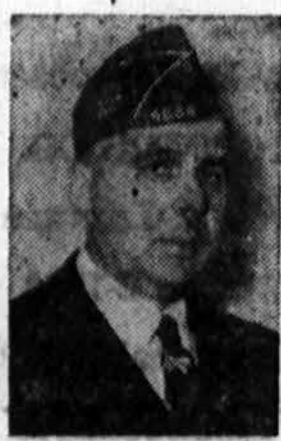
Viadas Klash K. of C. (Kolumbo Vydu) narys 4-to lapasno

1-TROPICAL FLOOR HEAT 2-CARBON-FREE BURNERS 3-PORCELAIN ENAMEL FINISH 4-TWO-IN-ONE HEATMAKER 5-SIEGLER-MATIC DRAFT 6-CAST IRON CONSTRUCTION