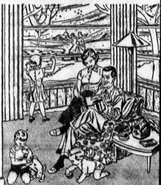
More and hotter heat over the floor than any stove!