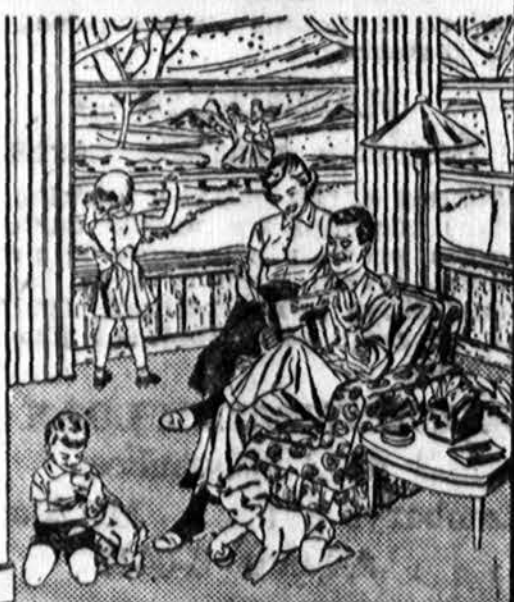
More and hotter heat over the floor than any stove

EVERYBODY WANTS IT—ONLY SIEGLER HAS IT—GETS TO THE BOTTOM OF THE COOL FLOOR PROBLEM!