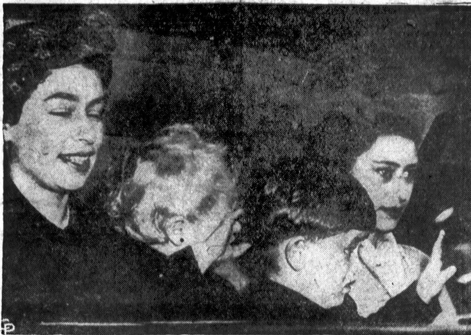
Anglijos karalienė Elzbieta II (kairėje) su savo dviem vaikais ir seserim Margarita sugrįžta į sostinę po vasaros viešnagės Škotijoje. Parlamentas greit pradės sesiją, kurią karalienė atidarys pasakydama kalbą apie būsimus Churchillio vyriausybės darbus.

Pralaimėjo komitete ir Prancūzija — siūloma diskutuoti Maroko ir Tuniso klausimus. Ir P. Afrikos segregacijos politika bus pakadenta, jei plenumas priimtų teko susikirsti su sovietiniu