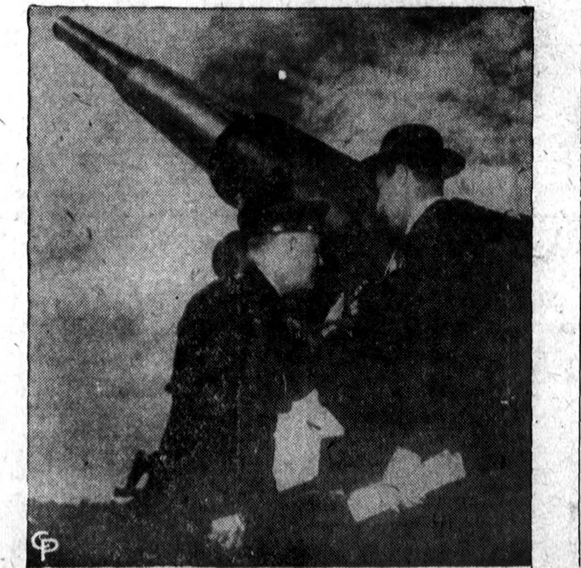
Atominė patranka. Armijos sekretorius Pace (dešinėje) ir armijos štabo viršininkas gen. Collins apžiūri 85 tonų patranką, iš kurios bus šaudoma atominiais šoviniais, kurie jau yra sandėliuose. Taikinių jieškoma Korėjoje.

SAIGONAS, spalio 17. — Indokinijos saugumo organai neskelbiamos asmens pagalba buvo atvesti į vieną Saigono priemiestyje esančią slėptuvę, kur buvo rengiami planai ir telkiamos priemonės JAV ambasadoriui Indokinijoje nužudyti. Slėptuvėje rasti šamokso įvykdymo planai, ginklai ir atentato organizavimo vadai, kuris, spėjama, yra komunistų politinis komisaras.