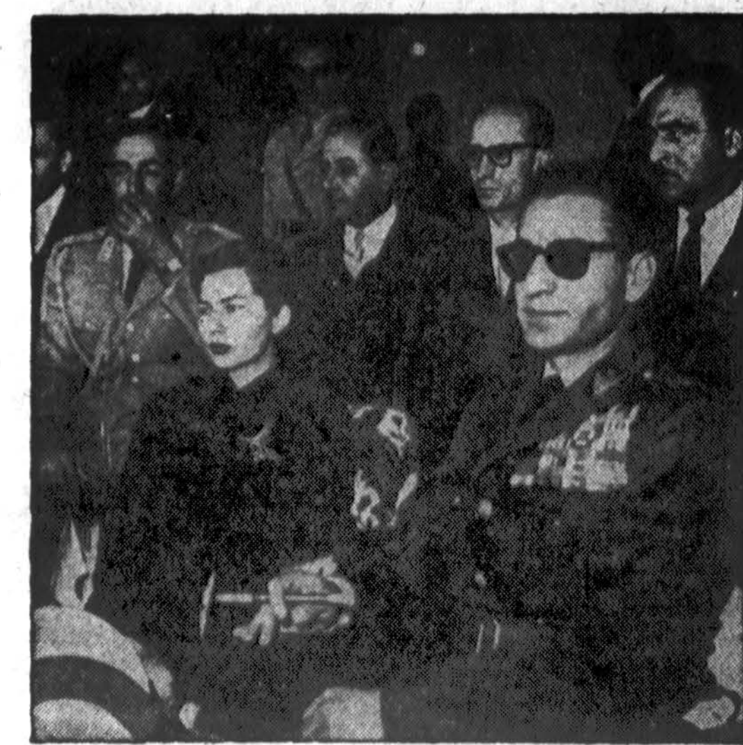
Persijos karalius ir karalienė stebi sporto rungtynes Teherano stadione. Komunistai ta proga bandė sukelti riaušes ir platinio karalių įleidžiančius šūkius. (INS)

BERLIN, lapkr. 11. — Sovietų okupacinėse įstajose R. Vokietijoje eilė civilių tarnautojų vėl pakeista kariškiais. Vakarų šaltiniai skelbia, kad tai padaryta ryšium su vokiečių kariuomenės organizavimu — norima tinkamos vietose padėti karinius patarėjus. Vakarų šaltiniai net mano, kad Sov. Rusijos okupacinė kariuomenė bus išvesta iš R. Vokietijos po to, kai vokiečių armija bus suorganizuota ir į patikimas rankas atiduota.