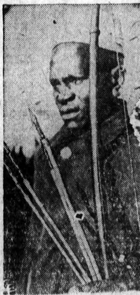
Kenijos policininkas išabūvis su iš Mau Mau teroristų palimtomis strėlėmis ir lanku. Spėjama kad koloniją terorizuoją Mau Mau organizacijos nariai savo aukas žudo ir užnuodytomis strėlėmis.

— Vakara būta daug kalbų apie tai, kad Indija su Australija rengė naują pasiūlymą Korėjos karo paliauboms išgauti.