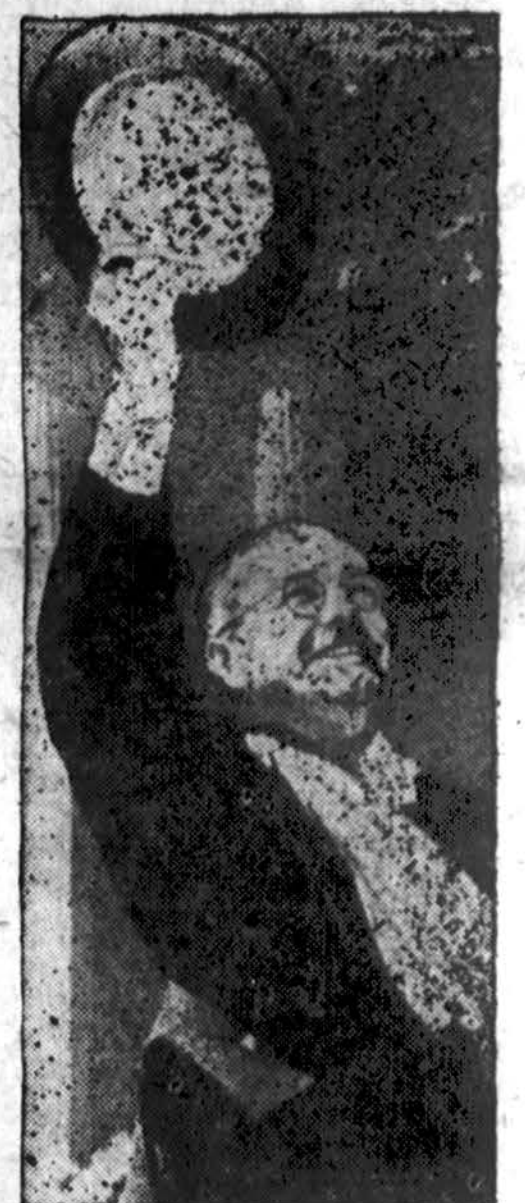
Naujasis Čilės prezidentas Carlos Ibanez inauguracijos dieną sveikina su sostinės gyventojais. Kadaiše revoliucijos nuverstas diktatorius, dabar išrinktas prezidentu iki 1958 m.

— V. Vokietijoje areštuoti keli buvę žymūs naciai, pradėję naudotis pabėgėlių organizacijomis savo politiniams tikslams siekti. Pačių nacių susikurtą partiją konstitucinis teismas įsėdė uždaryti ir turtą atimti.