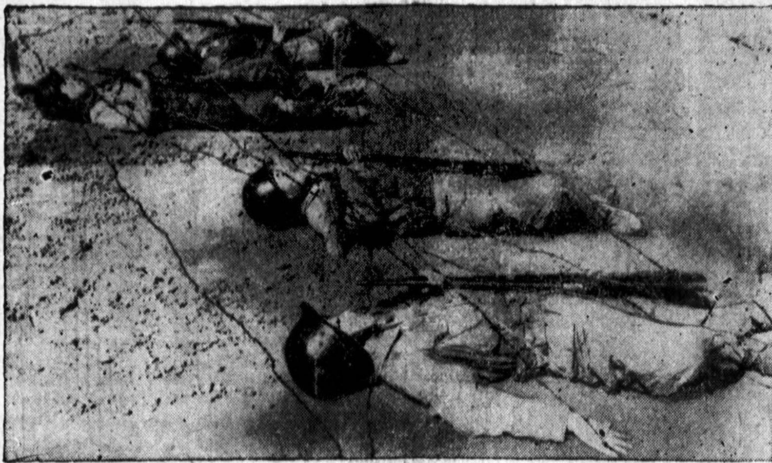
Infiltracijos pamoka. Pietų Korėjos vyrai apmokami kaip perėti įtarimo nesukėlus per spygliuotą vielų tvorą į priešų pusę uždavinių atlikti. Neseniai 55,000 apmokytų vyrų buvo įjungta į kovojantį frontą.