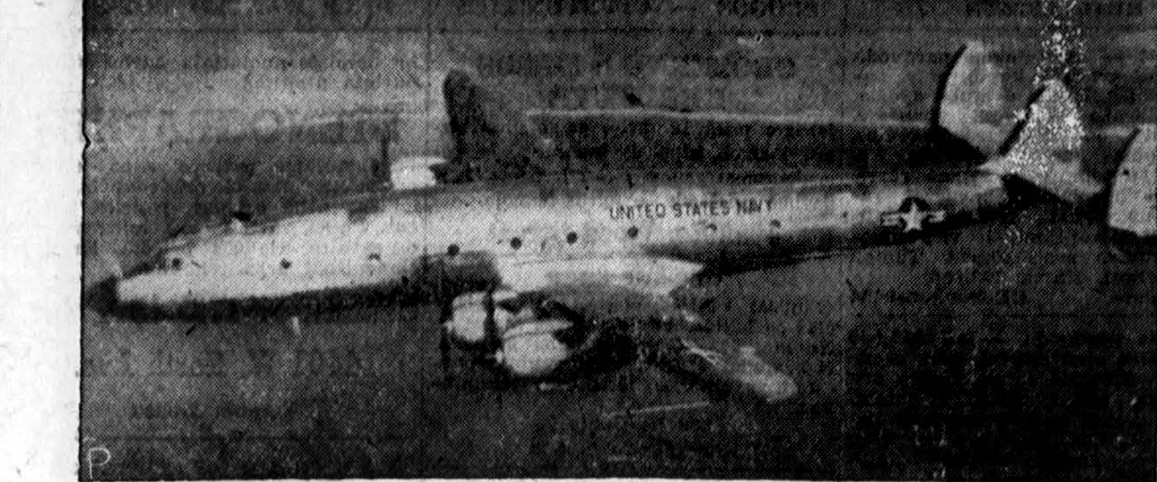
Naujas laivyno lėktuvas skrenda pirmą kartą virš Kalifornijos per valandą 400 mylių.