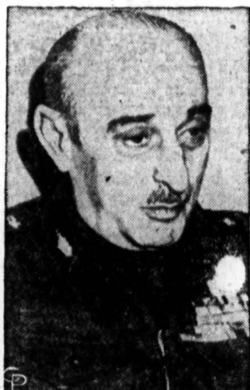
Maršalas Papagos, naujasis Graikijos ministeris pirminin- kas, kurio politinis sąjūdis lai- mėjo parlamento rinkimus.

Aviacija vakar numušė vieną priešą lėktuvą ir tas buvo pen- kas jį pagavusiam lakūnui.