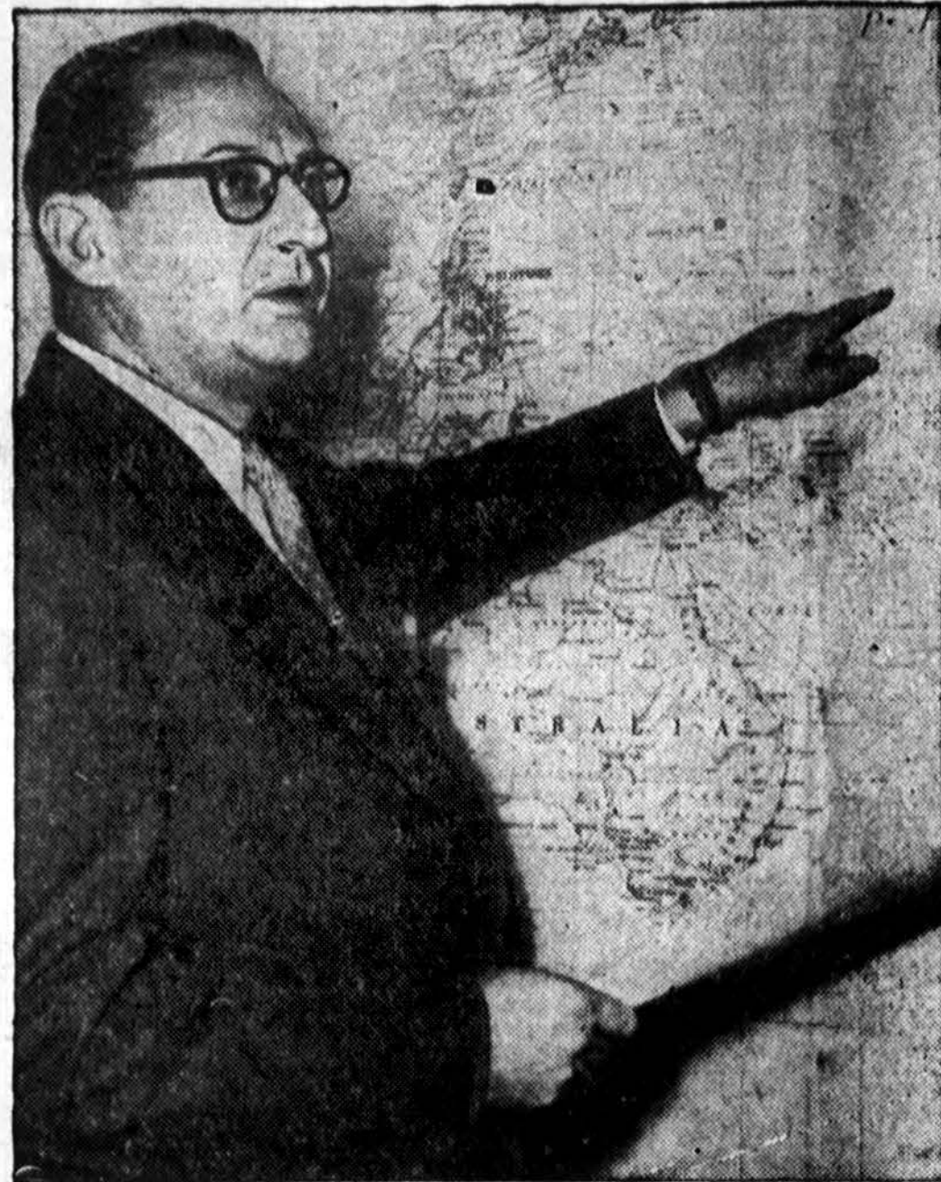
Atominės Energijos komisijos pirmininkas Gordon Dean rodo žemėlapyje vietą, kur įvyko bandymai su vandenilio bomba

Be jau turimų Grenlandijoje 3 aviacijos bazių JAV aviacija ga- lės ten dar 4 statyti: 2 naujas, 2 karo metu turėtas atnaujins. Bazių vietos nenurodomos, bet