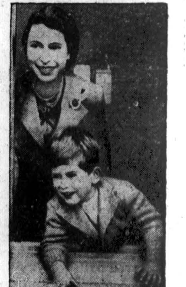
Motina ir sūnus. — Anglijos karalienė Elžbieta II su sūnumi princu Charles.