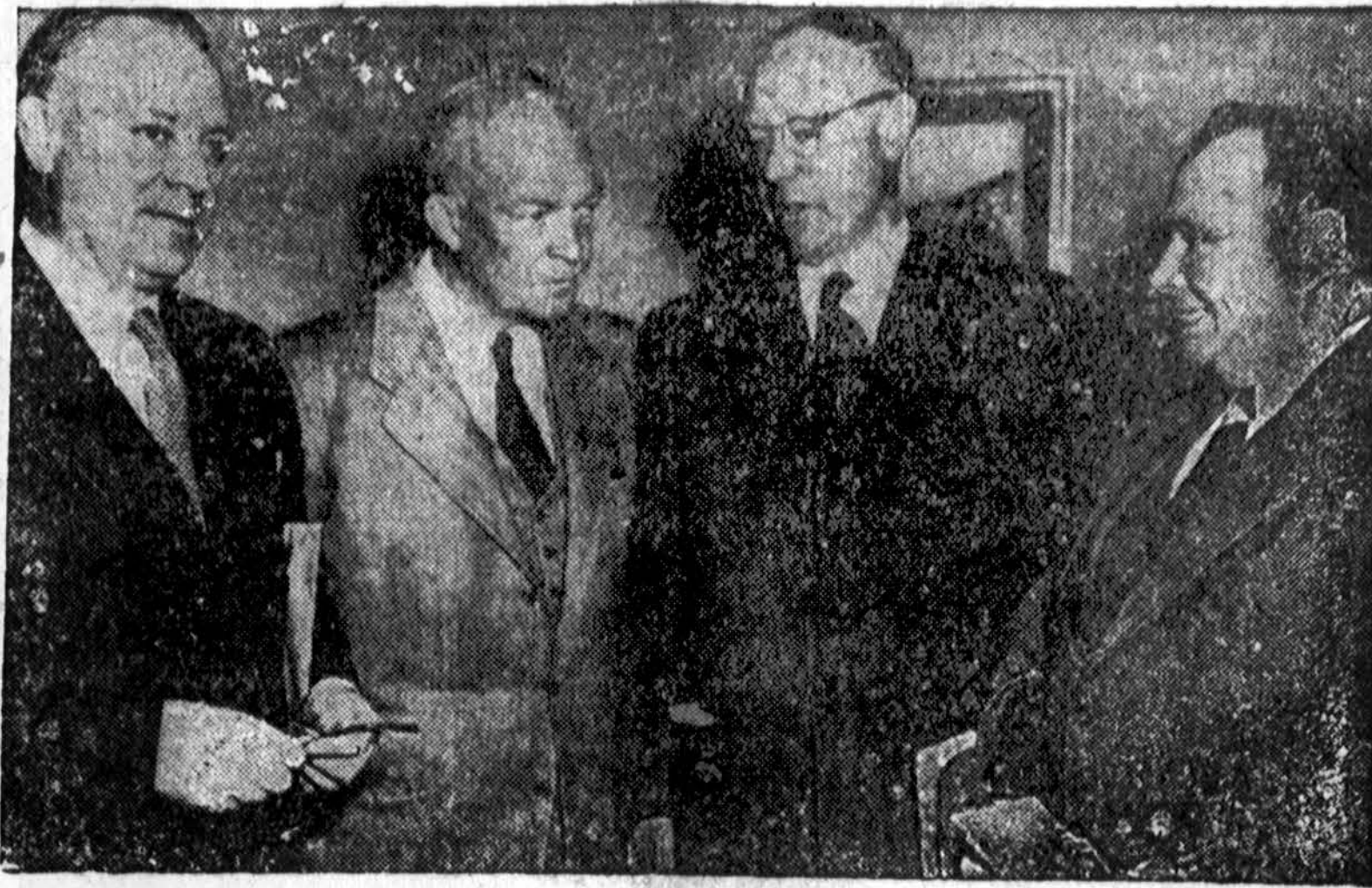
Susirūpinęs Eisenhoweris po pasitarimo su partijos kongreso vadais (sen. Bridges, sen. Taft ir kongresmanas Martin), kurie jam priminė, kad reikia teisėti prieš rinkimus duotus pažadus: sumažinti mokesčius, panaikinti infliacijos spaudimą, baigti Korėjos karą ir t.t. Bet kaktą susirūpinkia, kai reikia apsispręsti kaip tai padaryti.

Todėl jis siūlė rimčiau apsvarsyti reikalus ir nedaryti tokių neiškių sprendimų, kuriais būtų iškraipomi didieji laisvės principai ar bent mažinama jų vertė. Pagal teisybę, kaip jis priminė, dabartinės dvi rezolucijos sukuria dvi kategorijas žmonių, kurie turi teisę, kad jų reikalai būtų svarstomi: vienoje pusėje — mažas skaičius valstybių, ties kuriomis sukoncentruotas dėmesys ir kitoje pusėje — tautos, kurių yra daug ir kurias tos rezolucijos ignoruoja, bet kurių likimas yra ypatingai dėmesio vertas. Toje antrojoje kategorijoje, tarp kitų, yra ir 700 milijonų žmonių, kurie priklauso Sovietų Sąjungai ar jos „liaudies demokratijoms“.