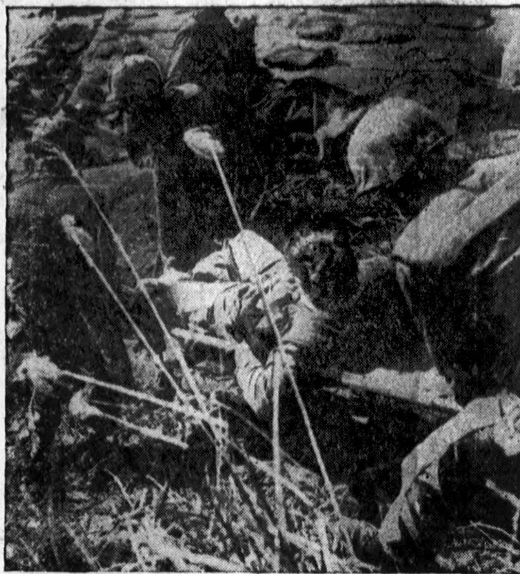
Korėjos karo vaizdai. Su dideliu vargu nuo kalnų nunešamas sužeistas karys į pirmosios pagalbos punktą. Sanitarai dėvi šarvuotas vestes, kurios gerai apsaugoja nuo šovinų skeveldrų.

Ypač dėmesio centre yra ponija Pandit. Ji, atrodo, iš visų įžymybių daugiausia bendrauja su delegacijų nariais. Nė ra tos dienos, kad jos nematytum besišnekučiuojant vyrų ir moterų apsuotos. Tai delegatų poilsio kambaryje ji sėdi, giliai atsisėmusi sofoje, tai spaudos barė ji kalbasi su savo pažįstamais reporteriais. Gražios išvaizdos ir grakščios eisenos, kalba ilgai ir energingai, bet rūpinasi tik savo valstybės