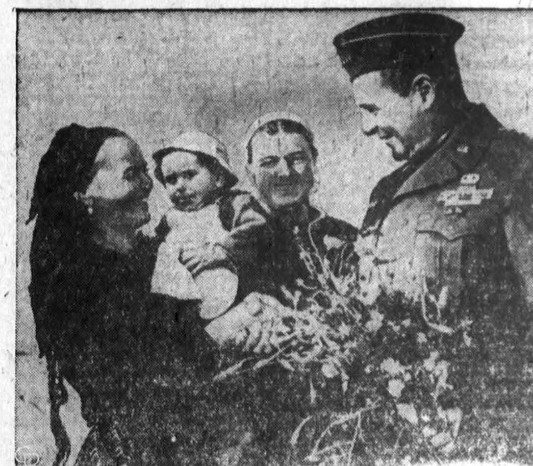
Laukų gėlės generolui. — Kur nors Graikijos Trakijoje, apie Salonikus, moterys įteikia Nato vyr. vadui gen. Ridgway gėlių, kai šis ten neseniai lankėsi žiūrėdamas vietą, kurias sutartiniai turisi ginti Turkija, Graikija ir Jugoslavija, jei Sov. Rusija kartais užsimanytu per Bulgariją priėti prie Viduržemio jūros.

• P. Korėjos prezidentas pasakė savo kariams labai laukius Eisenhowerio, nes šis esąs karys ir žinąs kaip karą vesti.