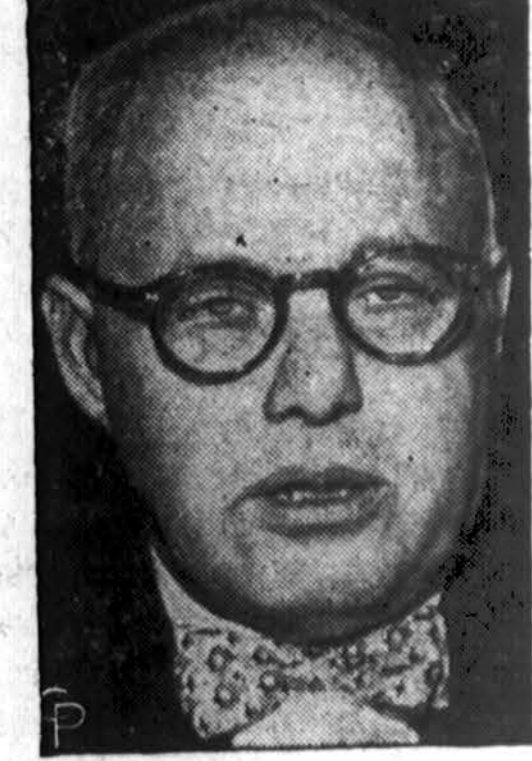
George Meany parinktas AFL pirmininku vietoj mirusio W. Green. Iškilį jis buvo išdinininku-sekretoriumi.

Debesuotumas didės, bet vis dar šalta. Temperatūra apie 27 laipsnius. Saulė teka 6:55, leidžiasi 4:23.