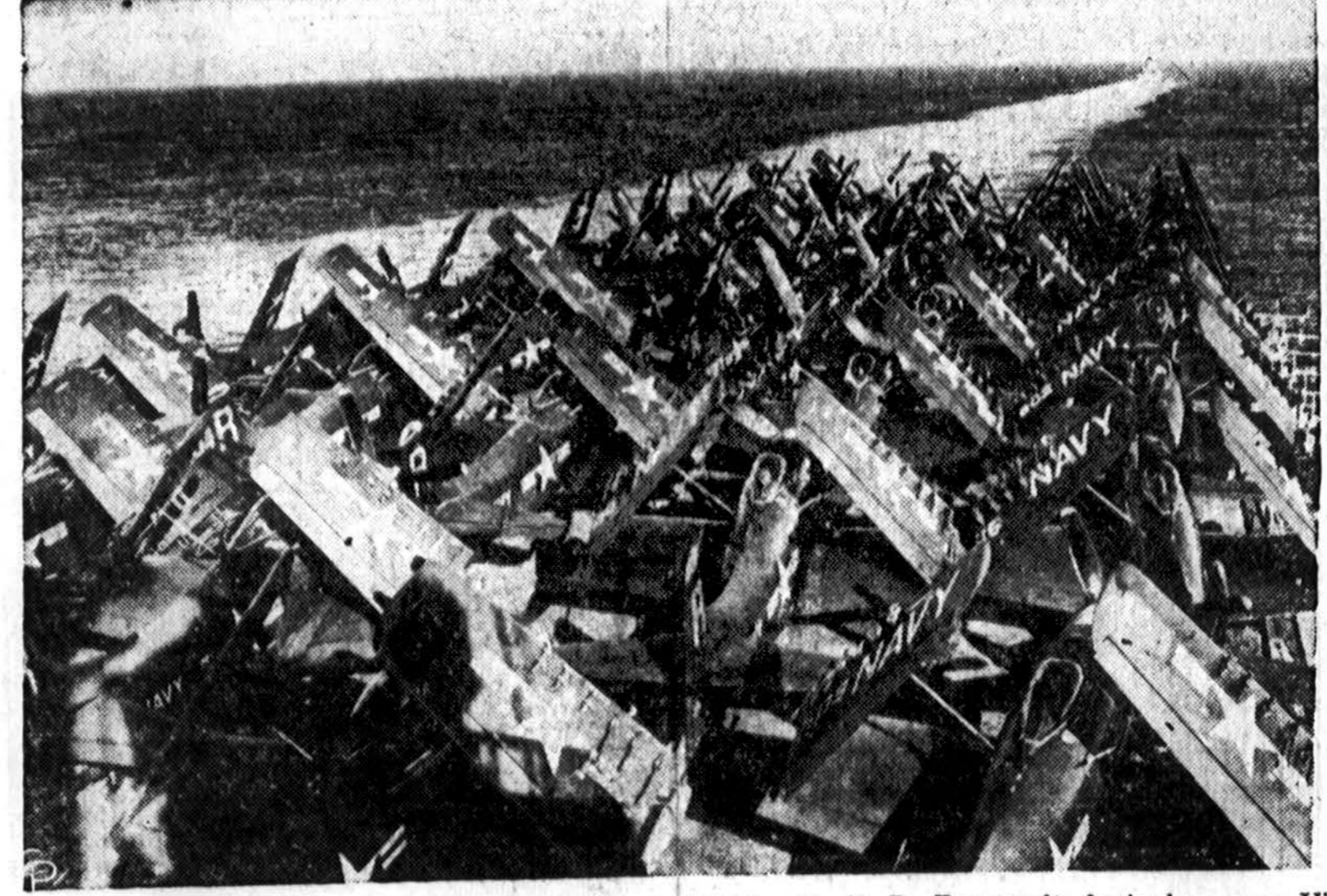
JAV laivyno lėktuvai sparnus suglaudę tupi ant lėktuvnešio F. D. Roosevelt denio kur nors Viduržemio jūroje pratimų metu. Dabar vykdomi karo pratimai yra didžiausi po karo ir juose dalyvauja 6 valstybių laivynai, aviacija ir kariuomenė.

Visą laiką protestavęs prieš šio klausimo kėlimą Jungtinių Tautų forume, Pietų Afrikos atstovas visai nesigilino į pačių kaltinimų esmę. Jį rėmė