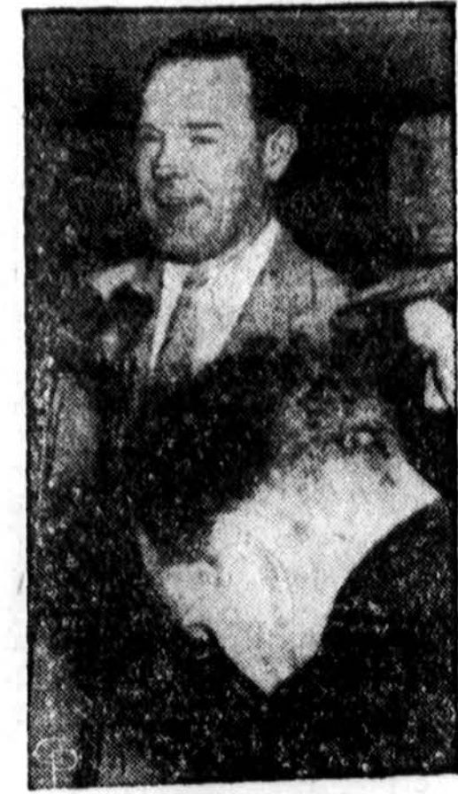
Sen. Henry Cabot Lodge (R), Massachusetts, pareiškęs, jog šis bus stebėtojas, o ne žinių šaltinis kol Eisenhoweris įžings į Baltuosius Rūmus