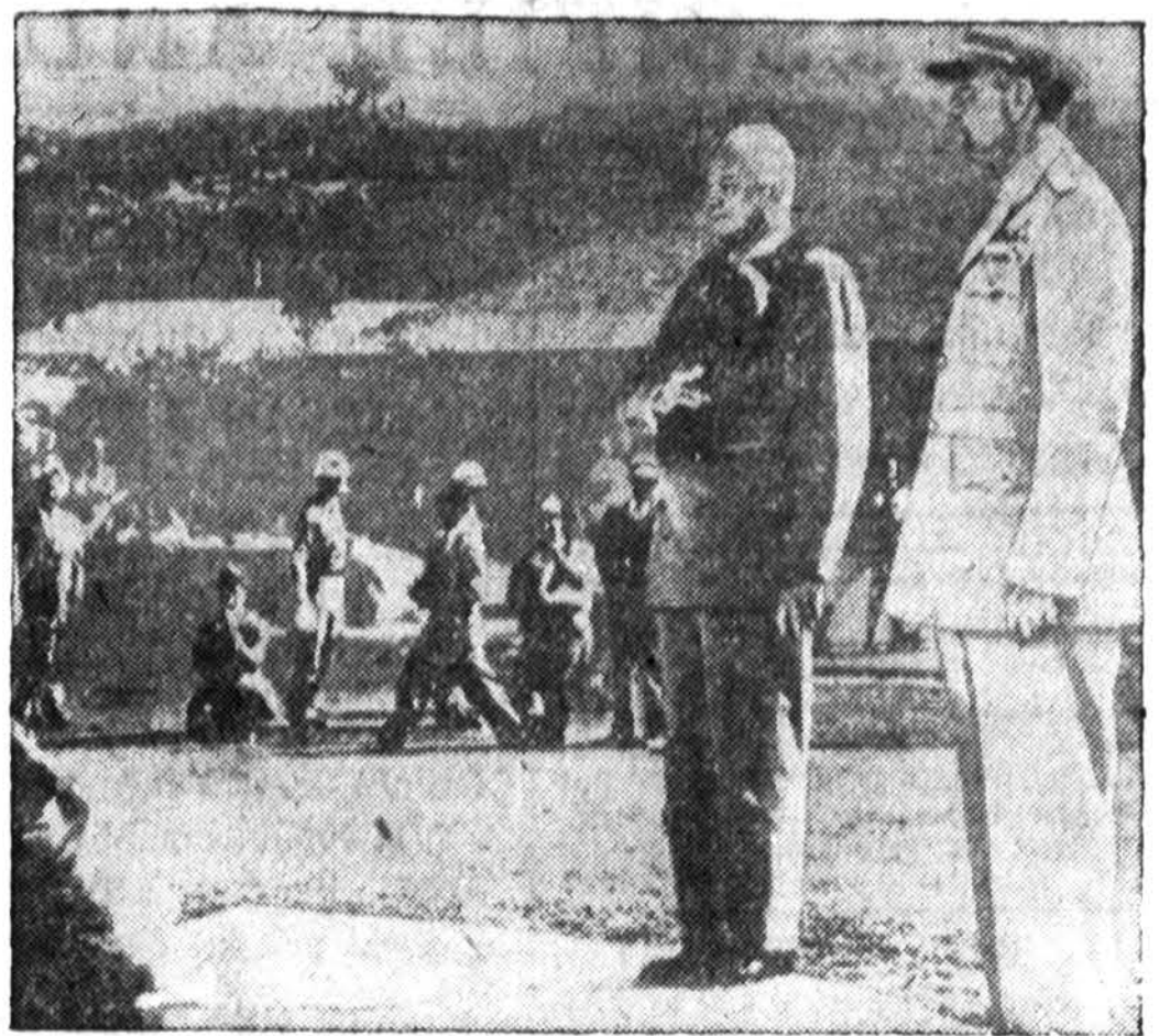
Išrinktas prezidentu Eisenhoweris, uždėjęs vainiką prie žuvusiųjų kare paminklo Punchbowl kapinėse, Havajuose, stovi su pagarbą. Kairėje stovi adm. Arthur Radford, Pacifiko laivyno vad.