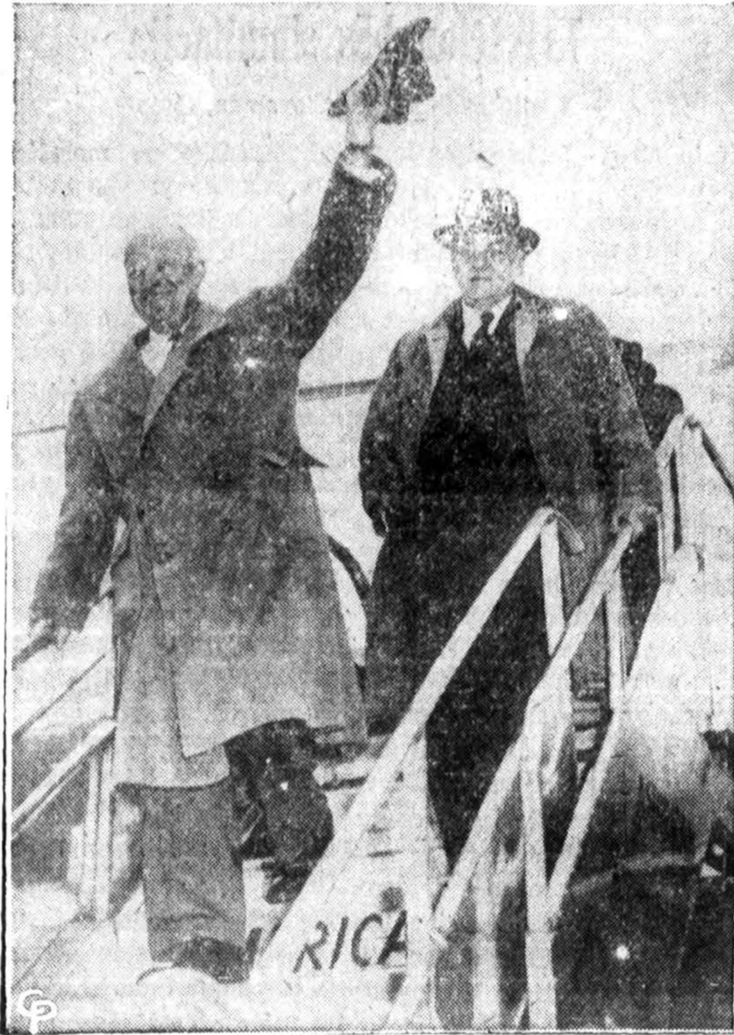
Išrinktas prezidentas gen. Eisenhoweris išlipa iš lėktuvo La Guardia areodrome, New Yorke, grįžęs iš Korėjos karo lauko, padarius 22,000 mylių. Gen. Eisenhowerį lydi John Foster Dulles.

ir rusinti lietuvius. Šitokie reiškiniai vis dėlto rodo, kad ir tokie jėgos garbintojai, kaip sovietai, nepasitiki taip jau labai savo dabartinius laimėjimais ir nori turėti atsargoje ir kitokių argumentų, negu tik plikas kumštis.