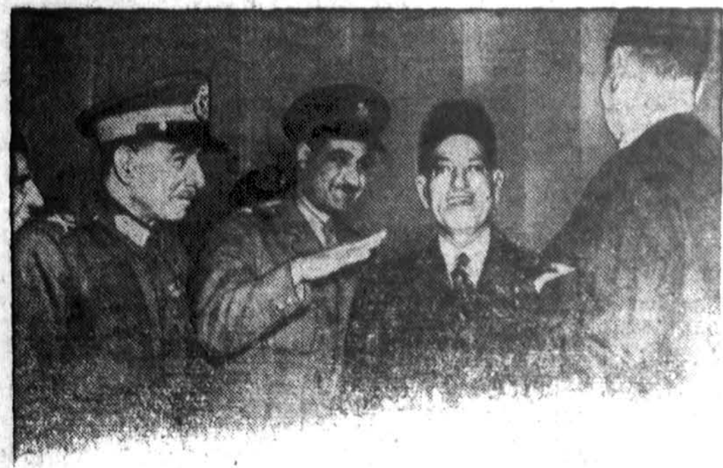
Egipto premjeras gen. Naguib (pirmas kairėje) pulkininko Abdel Naser lydimas padarė vizitą nuo Wafd partijos vadovybės nu-šalintam buv. premjerui El Nahas (trečias iš kairės). Naujasis Egipto reformatorius ieško bendros kalbos ir su buvusiais krašto valdytojais.

— Po MacArthuro ir Eisenhowerio pasitarimo vakar tik buvo pareikšta, kad kalbėtasi ne tik apie Korėją, bet ir apie kitas pa-saulio problemas ryšium su taikos išlaikymu.