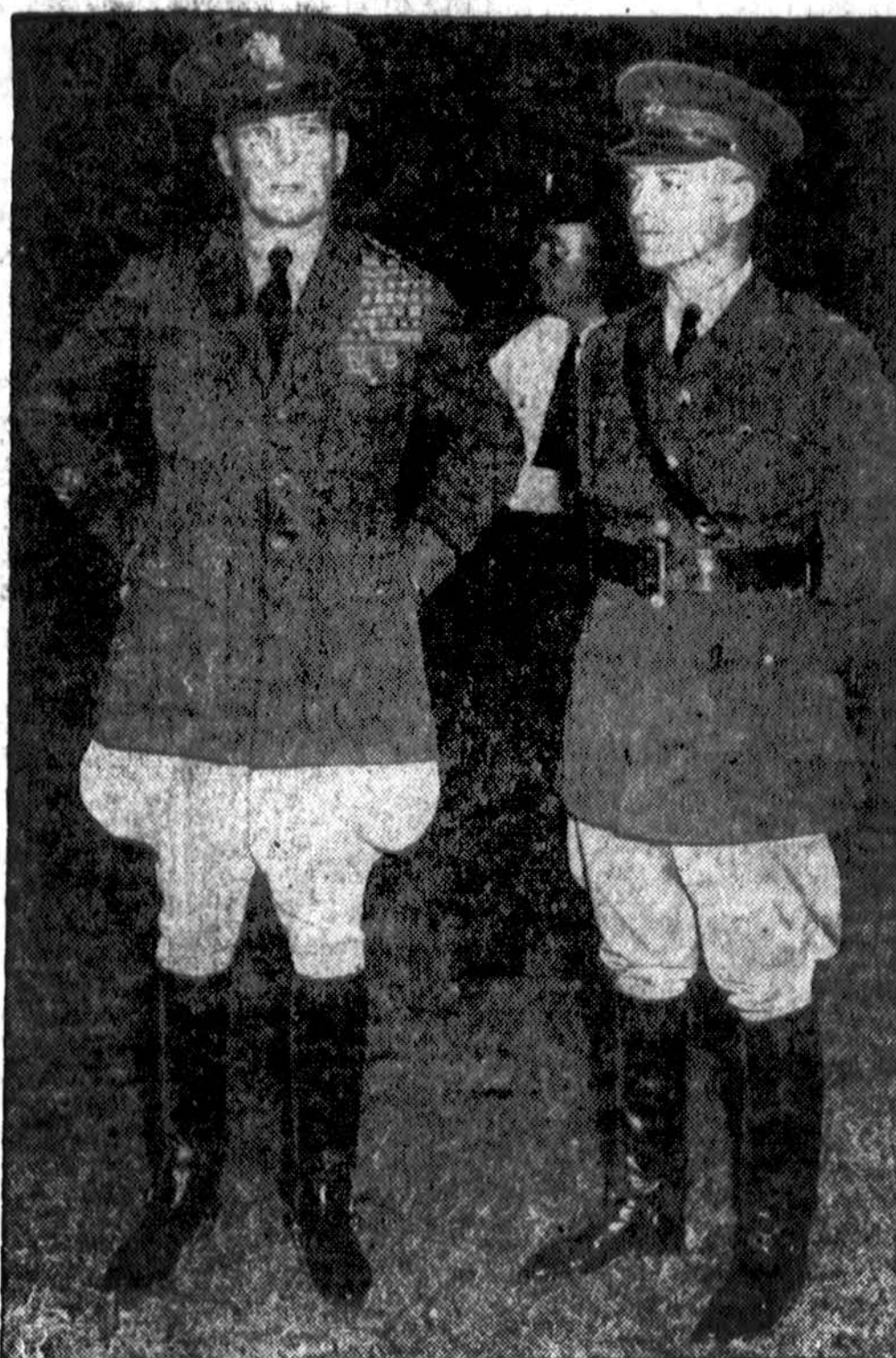
Kadaise juodu draugavo. — Čia yra gen. Douglas MacArthur (kairėje) ir majoras Eisenhower taisy laikais, kada gen. MacArthur buvo armijos štabo viršininku, o Eisenhower dirbo štabe. Vėliau gen. MacArthur išvyko į Filipinus to krašto kari-nių jėgų organizuoti ir savo štabo viršininku pasiėmė majorą Eisenhower. Karui prasidėjus jų keliai išsiskyrė, bet abudu pasiekė karinės garbės viršūnes kaip vyriausi karo vadai. Šian-dien Eisenhoweris įkopė į augščiausią savo krašto politinę vietą, o su karine vadovybe susipykęs gen. MacArthur pasiliko savo buvusio pavaldinio šešelyje.

● JAV socialistų partija nutarė ateityje nebestatyti kandida-tų federalinėms pareigoms (tu-rima galvoje prezidentūra), nes dabar dar nesą galima socialistus praveisti. Partija betgi nesilikivo-duoja.