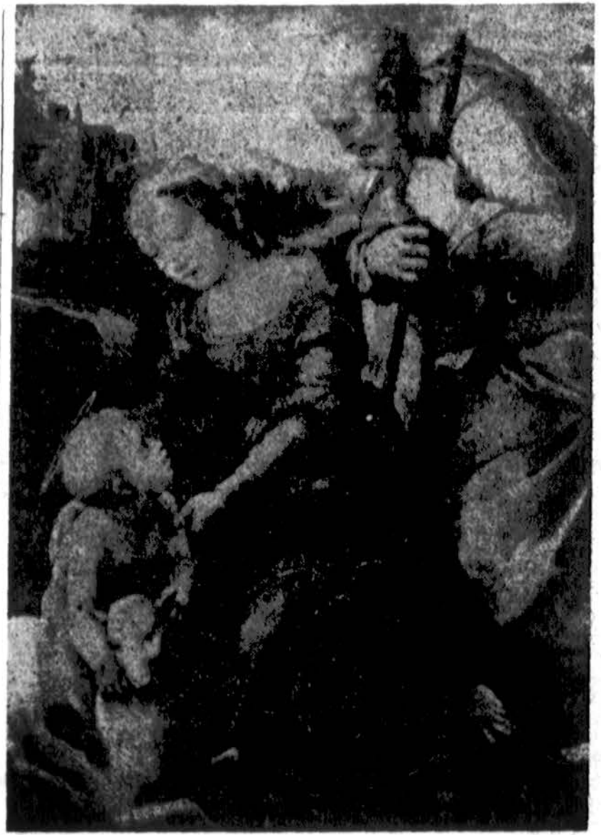
Sventoji Seima Rafaelis