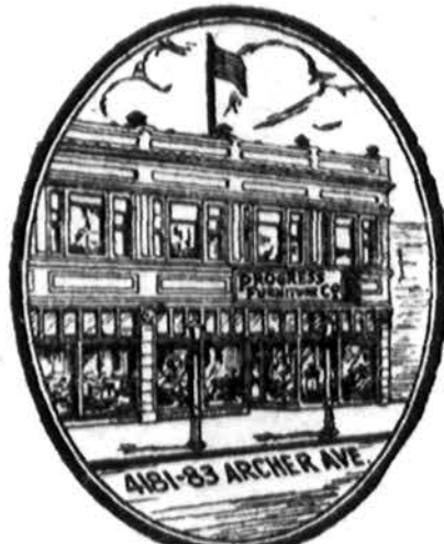
Progress krautuves namas

Esančius ir būsimus Rėmėjus, Prietelius ir visus Lietuvius