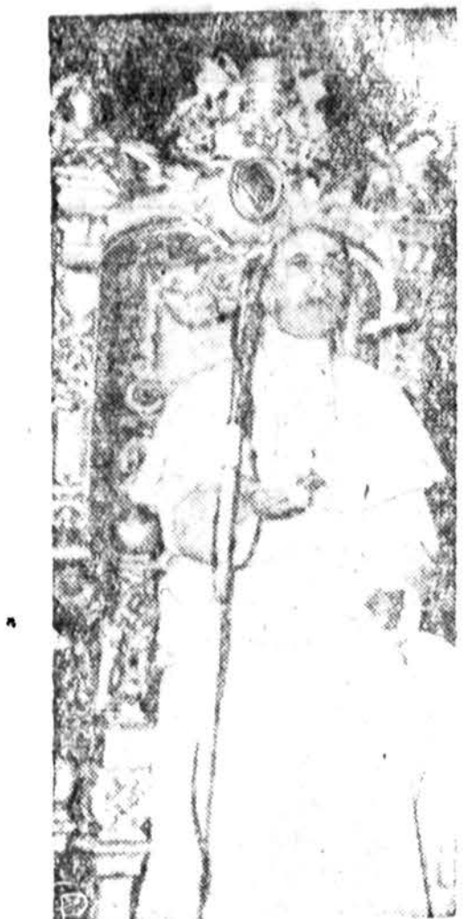
Popiežius Pijus XII kalba į visą pasaulį Kalėdų proga.

šos tautos praeigūnui. "Kai aš duosiu savo parodomąjį Kongresu nariams, reikalauju, kad būtų išleisti atitinkami įstatymai prieš įvairių rūšių komikų spaudimą. Tas padės išgelbėti kitų vaikų nuo mano sūnaus likimo!" — ryžtingai šaukia nelaimingoji motina.