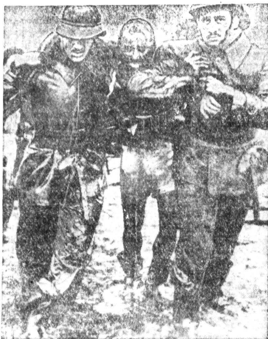
Gausrininkai neša išlikusį gyvą į krantą iš prancūzų Champolion laivo, kurį ištko skaudi katastrofa Beirut pakrantėje, Lebanon. 26 asmenys iš 318 žuvo, noredami pasiekti krantą.