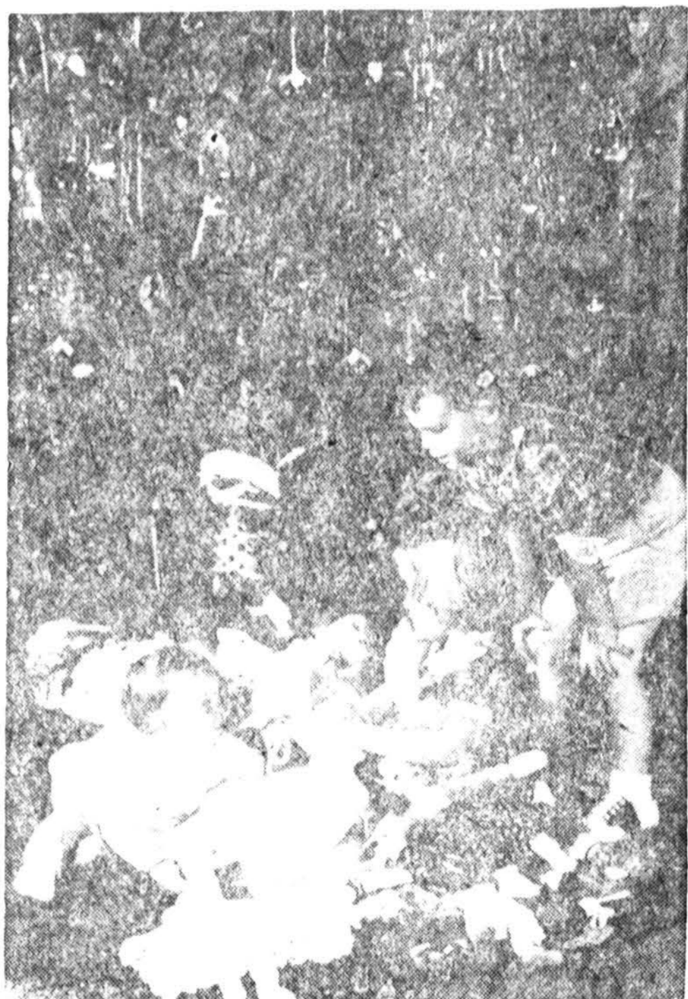
Išrinktojo prezidento gen. Eisenhowerio anūkai džiaugiasi Kalėdų eglute.