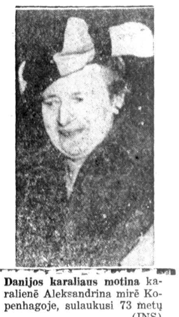
Danijos karaliaus motina karalienė Aleksandrina mirė Kopenhagoje, sulaukusi 73 metų (INS)

Oras Chicagoje Dalinai apsiniaukus, minkštas ir ramus oras. Temperatūra apie 42 laipsnius. Saulė teka 7:18, leidžiasi 4:29.