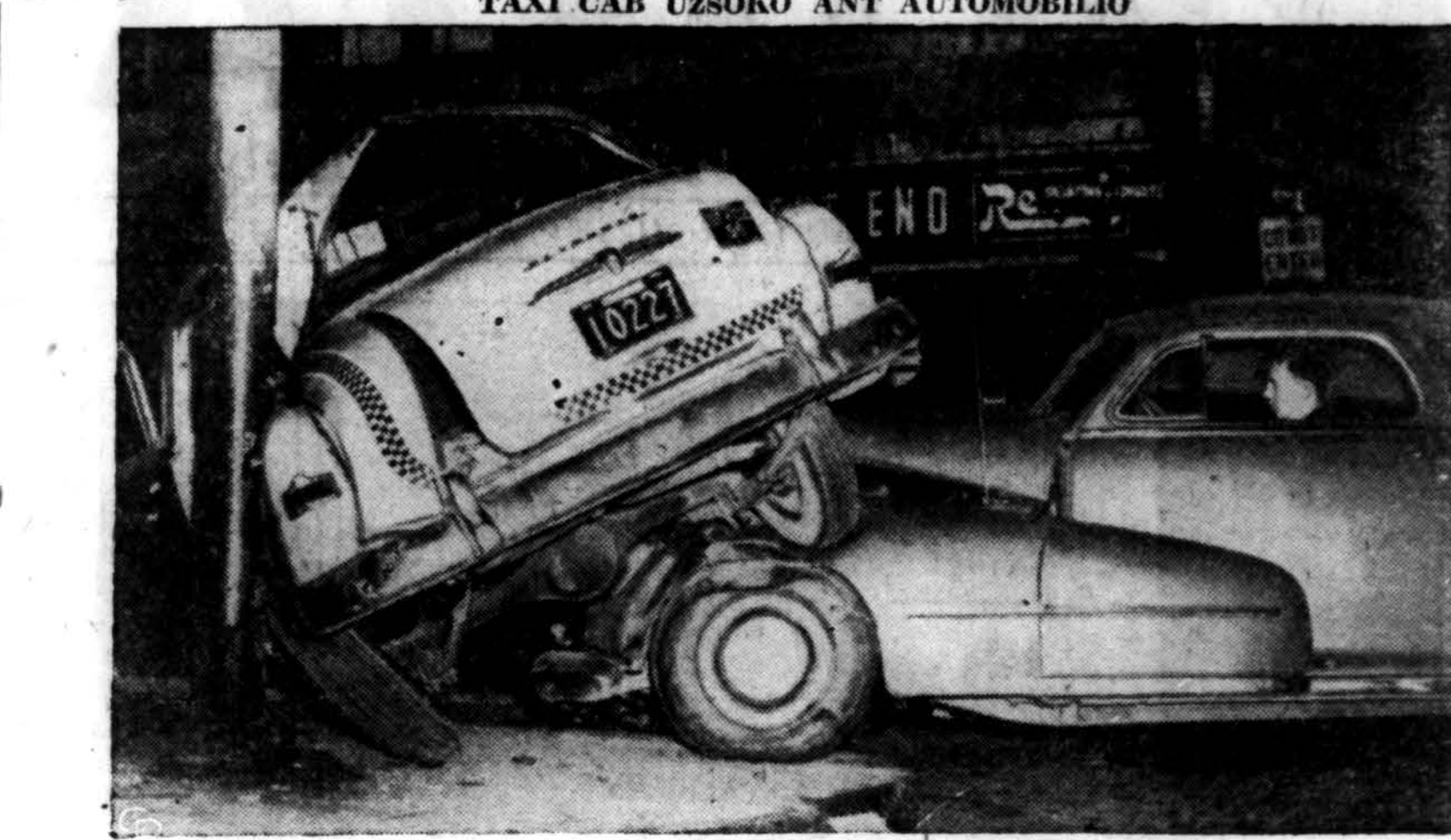
Taxi cab užsoko ant automobilio Bostone, Mass. Taxi cab vairuotojas sunkiai sužeistas, o automobilio vairuotojas liko sveikas.

Susirinkime nutarėme turėti 3 parengimus. Pirmas parengimas — "bingo" bus vasario 7