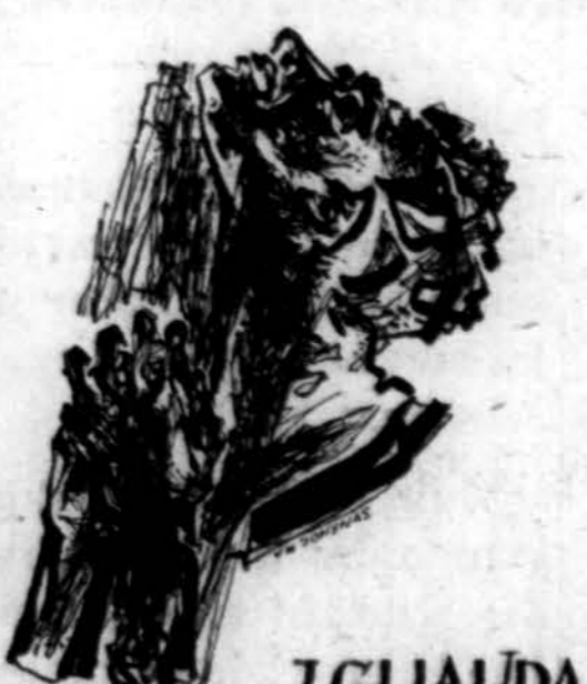
J. GLIAUDA ORA PRO NOBIS PREMIJŲ OTAS ROMANAS

Užsakymus siųsti: "DRAUGAS" 2334 So. Oakley Avenue Chicago 8, Illinois