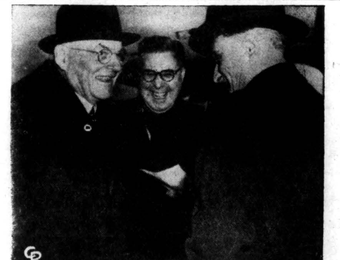
Išvykdamas į Berlyno konferenciją, valstybės sekretorius Dulles prieš lipdamas į lėktuvą persimetė žodžiu su Prancūzijos ambasadoriumi Washington Bonnet (dešinėje).