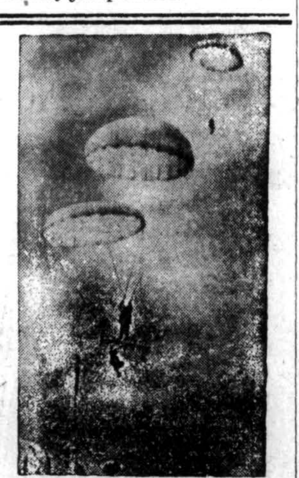
Dien Bien Phu tvirtovės gynėjams Indokinioje krenta pagalba iš augštybių.

Prieš rinkimus bus leista atnaujinti veiklą visoms partijoms ir paleisti politiniai kaliniai, išskyrus tuos, kurie sėdi teismo nutarimu. Vakar daug politinių kalinių jau paleista.