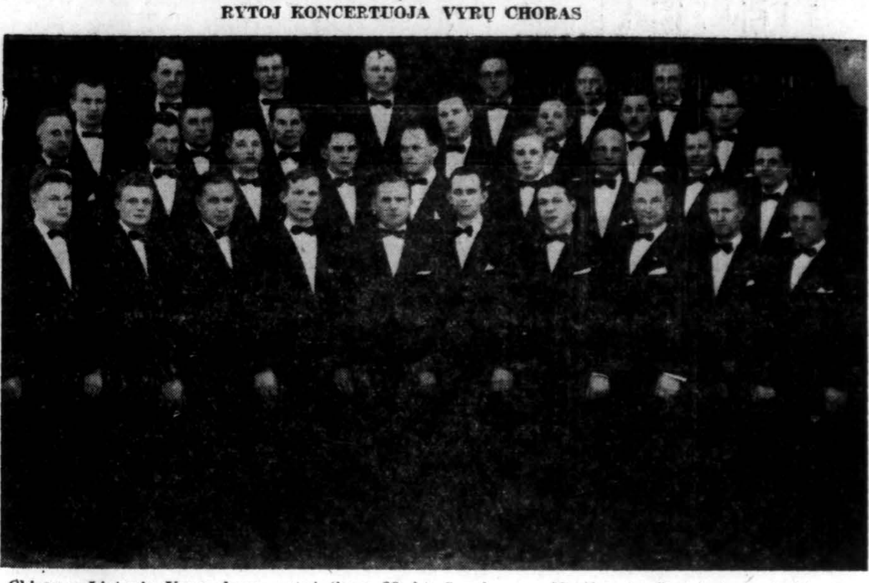
Chicago Lietuvių Vyrų choras rytoj (kovo 28 d.) - 5 val. p. p. Marijos Augštesniosios mokyklos salėje patieks lietuviškų dainų ir pasaulinių kūrinių koncertą. Visi kviečiami į įdomų koncertą.

Geriausia metų knyga! ŠIŲ METŲ LITERATŪROS PREMIJĄ LAIMEJUSI Bernardo Brazdžionio DIDŽIOJI KRYŽKELĖ Kaina 2 dol. Rašykite: 'DRAUGAS' 2334 So. Oakley Ave., Chicago, Illinois