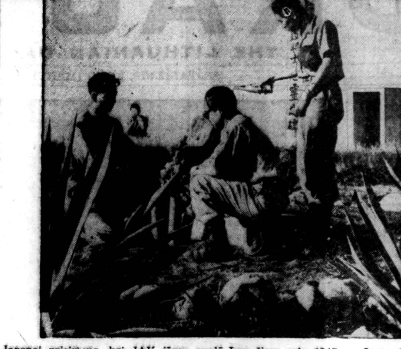
Japonai prisimena, kai JAV jėgos puolė Iwo Jima salą 1945 m. Japonai papuošė gelėmis savo žuvusių vyrų kapus.