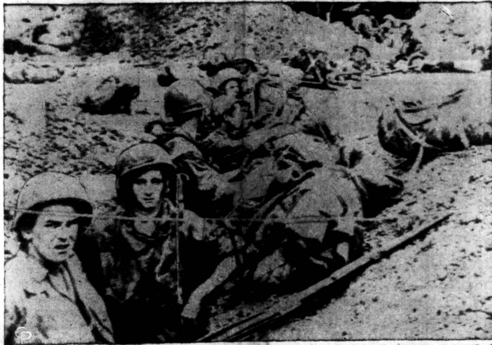
Prancūzų parašūtininkai įsirengia apkasose su Dien Bien Phu gynėjais vos tik atsirė nuo parašūtu, kurie čia pat matosi suvynioti. Čia nuolat kas nors krenta iš lėktuvo su parašūtu, nes lėktuvai negali nusileisti dėl priešų ugnies. Lėktuvų nasileidimo aikštė tebėra prancūzų rankose.

Tarpe trijų tūkstančių kalbų, kuriomis nūdien kalba pasaulis, UNESCO nurodo, kad daugiausia naudojamos yra kinų, anglų, rusų, ispanų, vokiečių, japonų, prancūzų, portugalų, italų, arabų ir kt. Tarpe kalbų, kurios nuo I Pasaulio karo pabaigos yra įgijusios pilną tautinį ar regionalinį statusą, minima ir lietuvių kalba. Lietuviai minimi kartu su čekais, slovenais, latviais, estais, gudais, ukrainiais ir kt.