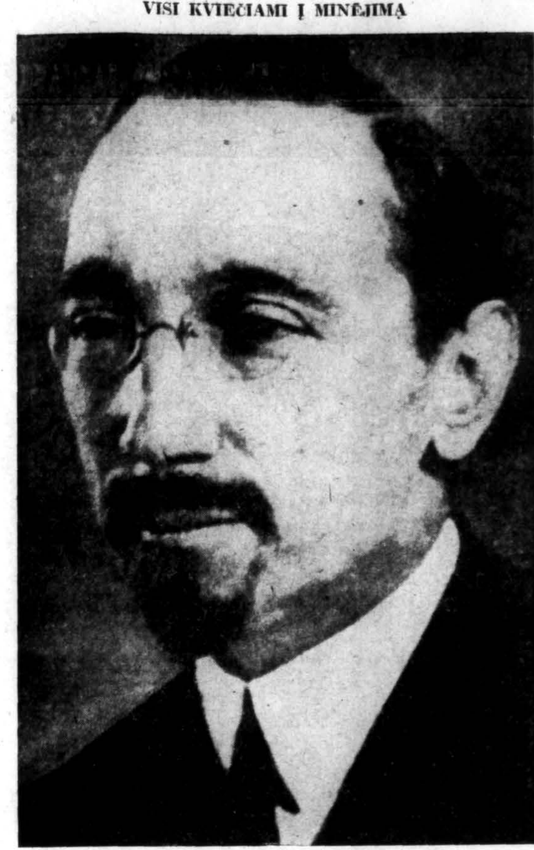
A. a. prof. Stasys Šalkauskis, Ateitininkų ideologas, pagerbime rytoj (balandžio 11 d.) 3 val. p. p. Šv. Kazimiero akademijos salėje. Bus turinama akademija. Visi kviečiami.

tinai turės pasireikšti kasdieniame gyvenime; nebus jam būtino reikalo pasireikšti išoriniai: numonėmis, skonių ar būdais, kurie pasirenkami, atliekant darbus. Tai yra kažkas sielos gilumoj.