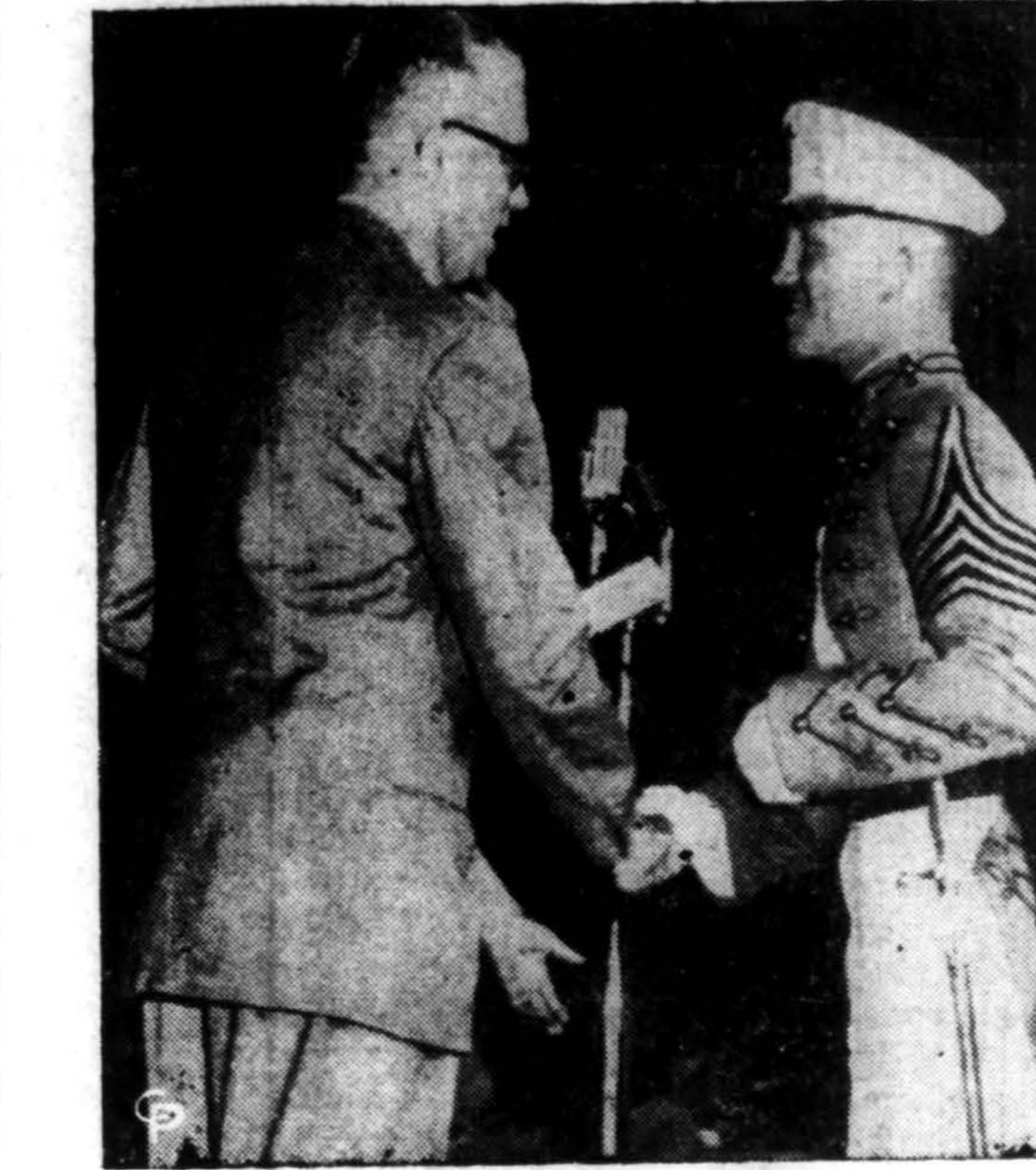
Armijos sekretorius Stevens dalina diplomus West Point karo akademią baigusiems leitenantams, kurių šiemet yra 634. Savo kalboje, kurią spauda vadina karinga, Stevens pažadėjo ginti karininkus nuo neužtarnautų užpildinėjimų (atsiminimas incidentų su sen. McCarthy).

Kalendorius Birželio 12 d.: šv. Jonas iš Fakundo. Lietuviškas: Uosis ir Rūta. Birželio 13 d.: šv. Trejybės šventė.