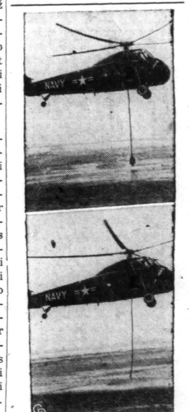
JAV laivyno helikopteris, skirtas povandeniniams laivams medžioti. Sekimo prietaisais yra ant viršaus galo.

Naujais premjeris esą numatyti šie asmenys: radikalsocialistų Rene Mayer, Mendes - France ir pats Bidault, dažnas užsienių reikalų ministeris pokarinėse vyriausybėse. Tokį patarimą esąs davęs prezidentui iš Genevos grįžęs Bidault, nes Prancūzijos parlamento sudėtis dabar tokia, kad negalima išspręsti nė vieno rimtesnio už užsienio ne vidaus politikos klausimo.