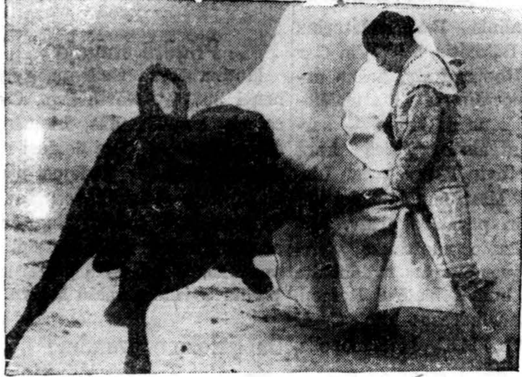
Ispanijoje vis dar tebemėgstama žaisti su jaučiais. Čia matome vieną tokį momentą, stebint tūkstantinei miniai žmonių Madridyje.