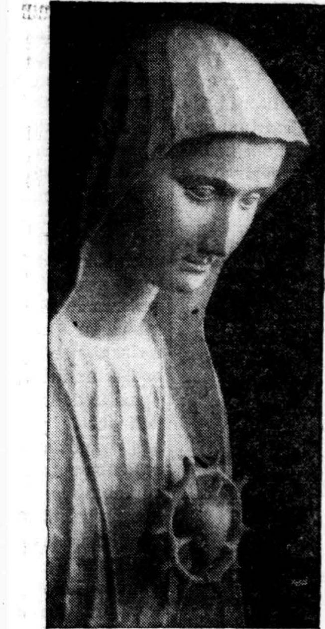
"My immaculate Heart will be your refuge and the way that will lead you to God."