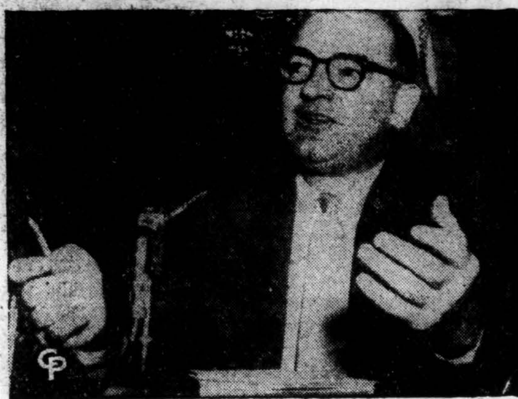
Sen. Joseph R. McCarthy (R., Wisc.) "cenzūros byloje". Griežtai atmeta prieš jį iškeltus kaltinimus.