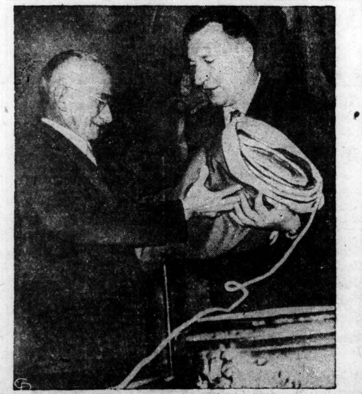
Italijos prezidentas Einaudi (kairėje) įteikia Triesto merui Italijos vėliava, kad ją pakabintų ant miesto valdybos rūmų perimant miestą iš sąjungininkų valdžios.

Egiptas tiria reikalą iš savo pusės ir tvirtina, kad Palestinos tanklaivio įgula apšaudė Egiptą žvejų laivus, bet Izraelis tokią galimybę neigia. Egipto atstovas Saugumo Tarybai pranešė, kad žydų laivo įgula bus paleista, jei tardymas parodys ją esant nekaltą; jei kaltinimai pasitvirtins, juos teis Egipto teismas kaip paprastus kriminalistus.