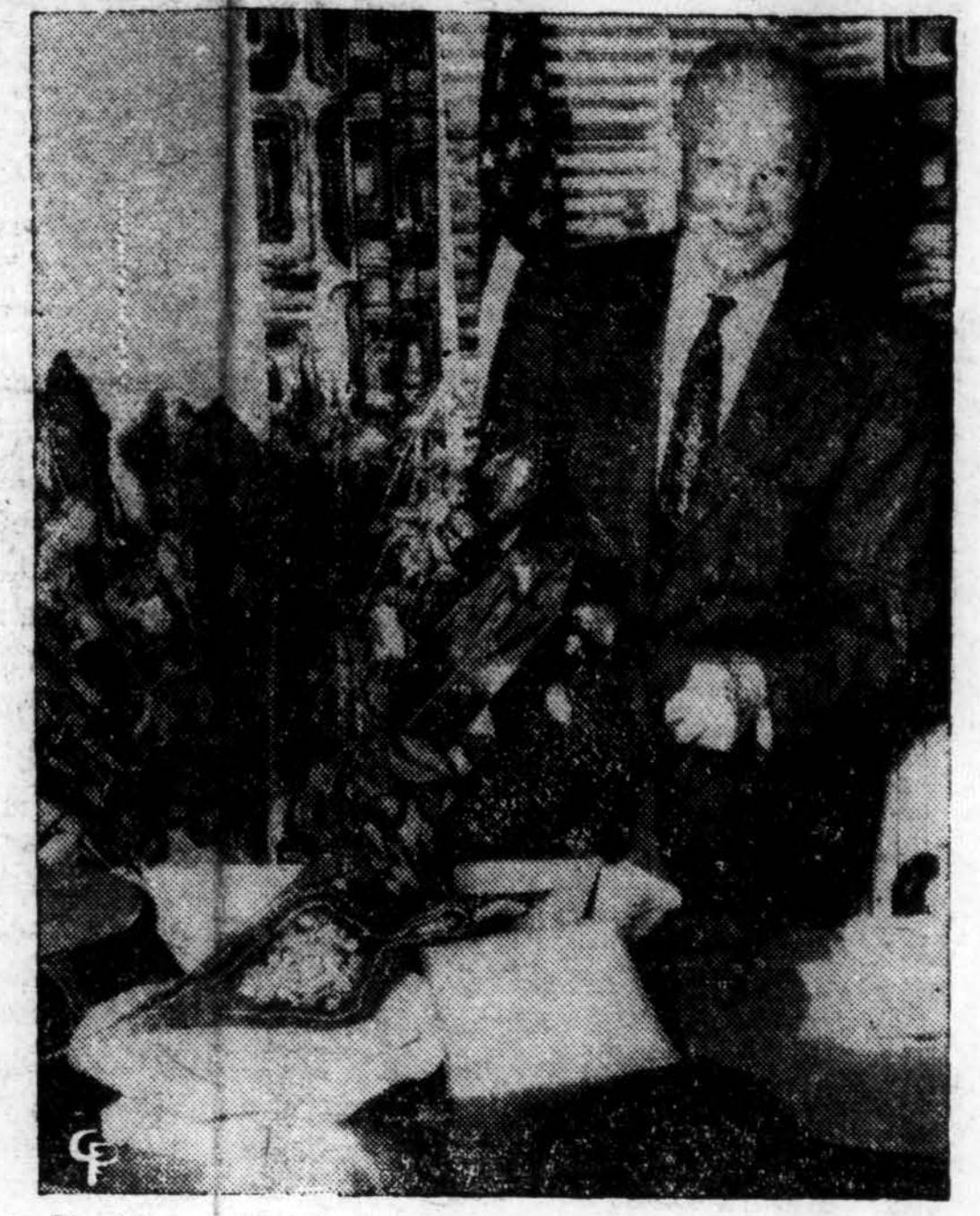
Prez. Eisenhower apžiūri dovanas, gautas 64-jo gimtadienio proga. Tarp dovanų buvo ir 64 rožės, padovanotos jo raštinės tarnautojų.

Colombo (pagal Ceilono sostinės vardą) planas yra britų Commonwealth iniciatyva 1951 m. pradėtas mažasis Marshall planas pietų ir pietryčių Azijos kraštų ūkiui plėsti vienas kitam padedant. Dabar Kanada vykdyje konferencijoje į planą įjungta Japonija, Siamas ir Filipinai. Prieš tai plane jau dalyvavo Australija, Burma, Kambodija, Ceilonas, Indija, Indonezija, Laos, Nepalas, N. Zelandija, Pakistanas, Anglija, JAV ir Vietnamas.