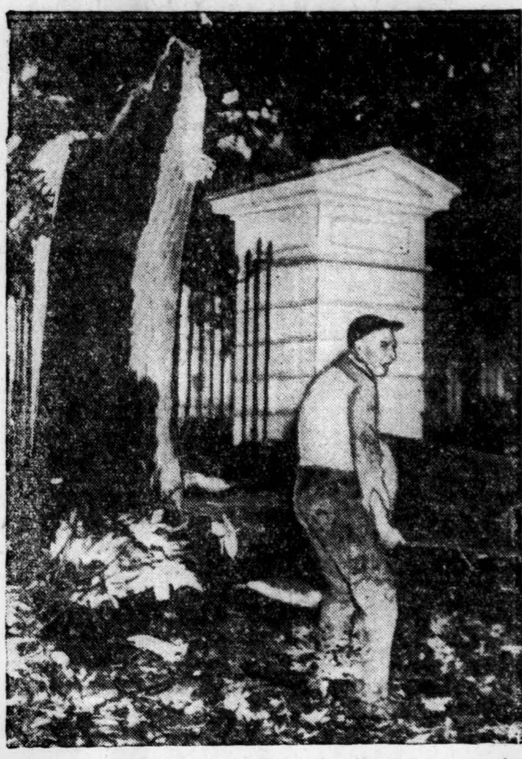
Baltųjų Rūmų darbininkai valo Pensilvanijos gatvę nuo akmuo, medžių ir plytų, kurias primetė praužęs Hazel uraganas.

dvasios tyrumo, kurio gal niekad nepatirtų gyvendami nei už daruose vienuolynuose. Jie ten išgyvena tiek sielos džiaugsmo, kad jie paprastai nebenori iš ten grįžti į paliktą ramią pertekliu ir civilizacijos aplinką. Visa jų imuniteto ir savijautos paslaptis glūdi Dievo ir artimo meilėje.