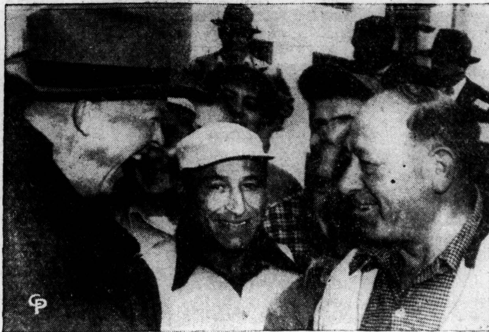
New Yorke prezidentas Eisenhoweris kalbasi su darbininkais gatvėse. Jis čia buvo atvykęs paraginti, kad žmonės balsuotų už sen. Irving M. Ives.