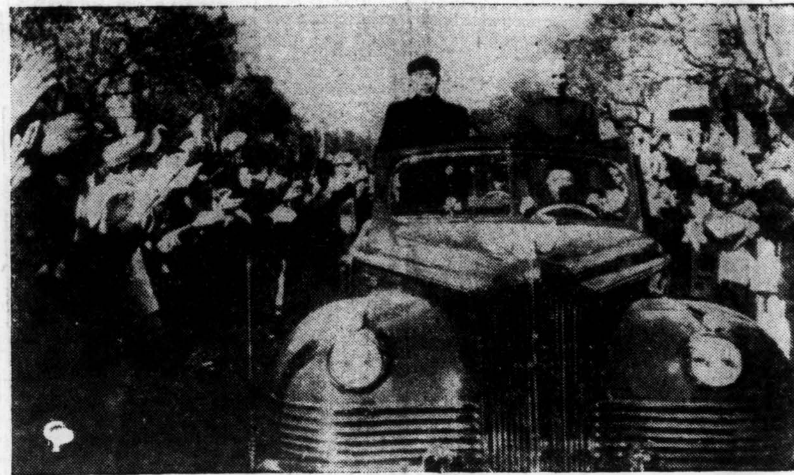
Nehru viešnagė Kinijoje. — Čia matomi Indijos premjeras Nehru ir kom. Kinijos premjeras Chou En-lai važinėja Peipingo gatvėmis Nehru garbei suorganizuotame parade. Nehru baigė pasitarimus Peipinge paneigdamas gandus, kad jo kelionė nepasisėkė.

Jis toliau nurodė, kad vien per pirmą 1954 m. pusmetį iš Sovietų Sąjungos ir satelitinių kraštų į Vakarų atbėgo arti penkių tūkstančių. Jų tarpe yra 989 iš Sovietų Sąjungos, 350 iš Albanijos, 29 iš Pabaltijo kraštų (Lietuvos, Latvijos ir Estijos), 141 iš Bulgarijos, 1,234 iš Čekijos, 791 iš Vengrijos, 844 iš Lenkijos, 246 iš Rumunijos ir t.t. Per tą patį laiką iš Rytų Vokietijos buvo per 95 tūkst. pabėgėlių.