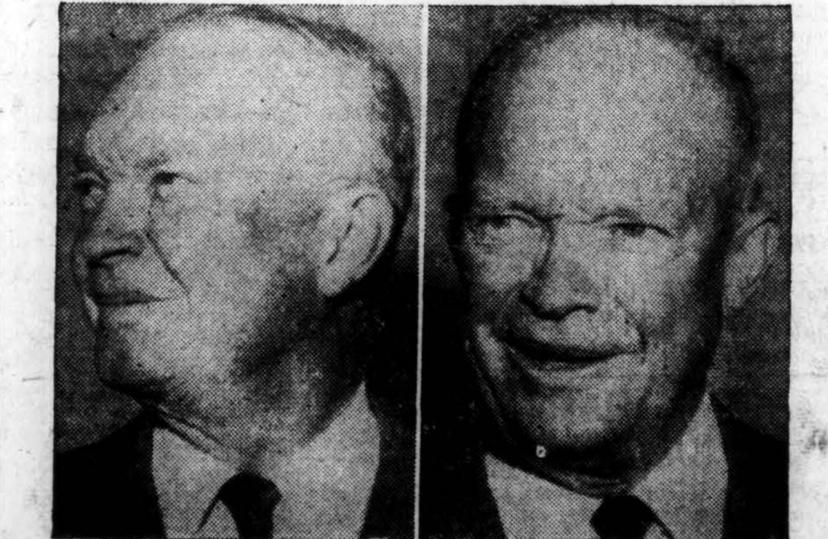
Prez. Eisenhower pirmoje po vasaros atostogų spaudos konferencijoje

Apsiniaukus, temperatūra apie 50 laipsnių. Saulė teka 6:19, leidžiasi 4:50.