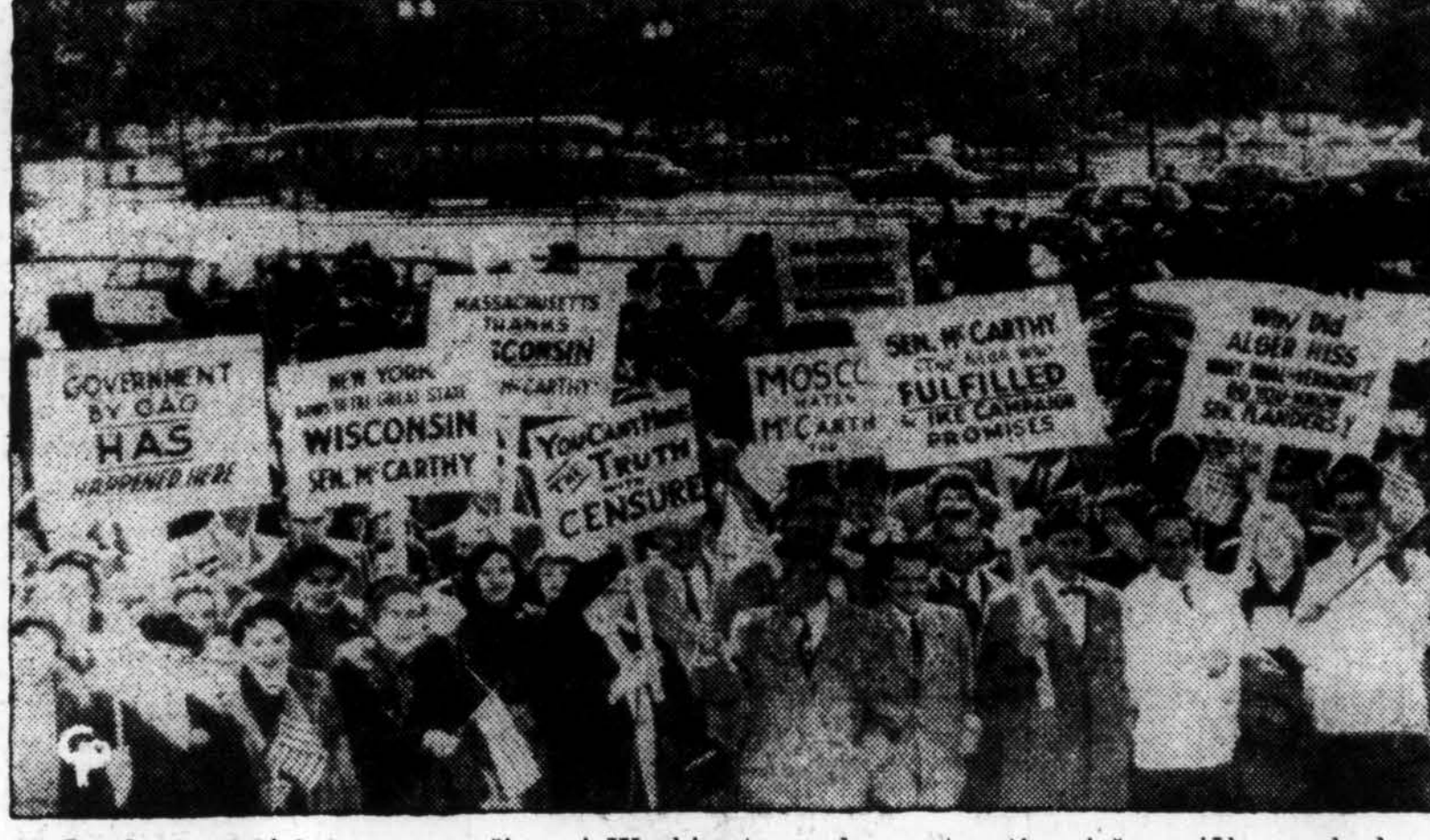
Sen. McCarthy gerbėjai buvo suvažiavę į Washingtoną demonstruoti prieš pasiūlymą, kad senatorius būtų papeiktas už kaikiurius savo veiksmus. Toks protesto susirinkimas įvyko ketvirtadienio vakare Constitution Hall Veteranų dienos m. nėjimo progą.