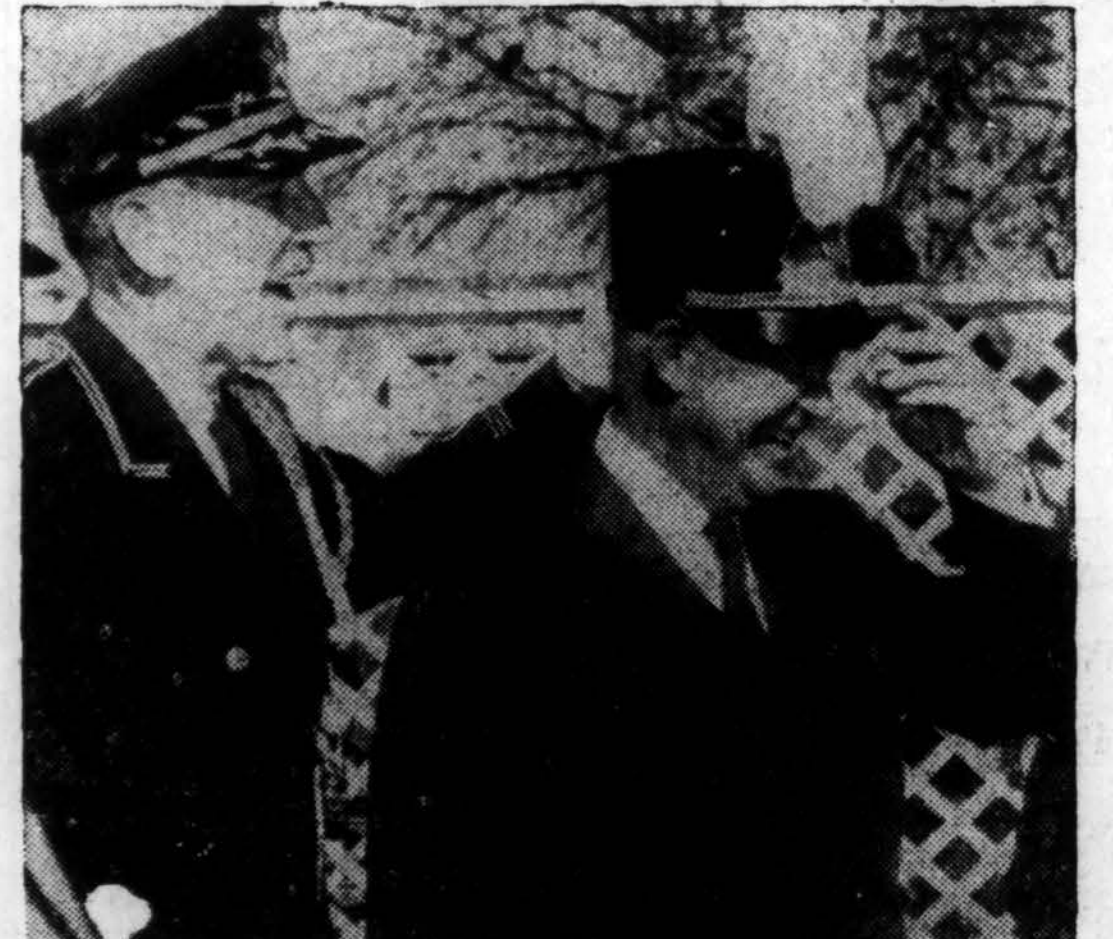
Prez. Eisenhower savo gimtinėje Abilene mieste Kansas valstybėje atidaro savo vardo muzėjų. Po to prezidentas nvyko medioti į Ohio valstybę.

Gen. Naguib ir pulk. Nasser vertimui, bet paskui susinovė dėl valdžios. Viešumon iškilęs ginčas buvo išspręstas Naguib duodant mažai teisių teturinčią prezidento vietą, o Nasser paimant visą krašto vadovybę. Tik šios bylos eiga parodys, koks bus tolimesnis gen. Naguib likimas.