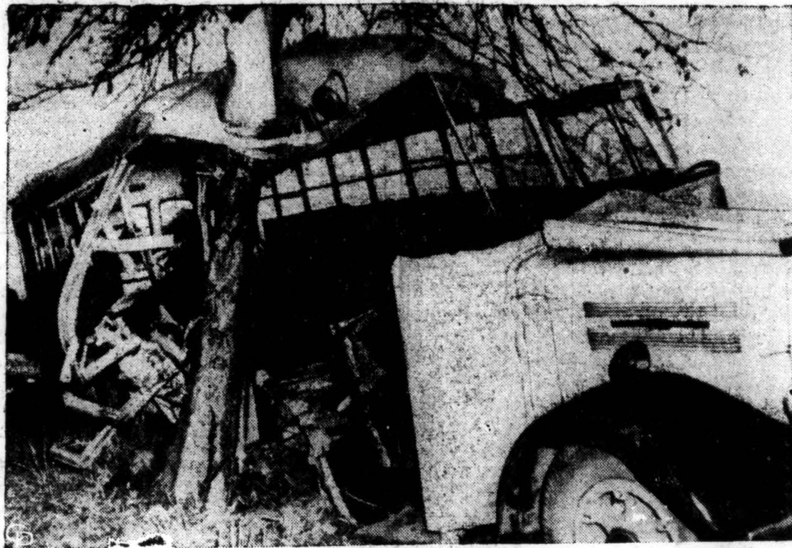
Taip baigėsi kelionė mokyklos autobuso prie Columbus, Ohio. Trisdešimt vaikų sužeista, bet tik du rimtai.