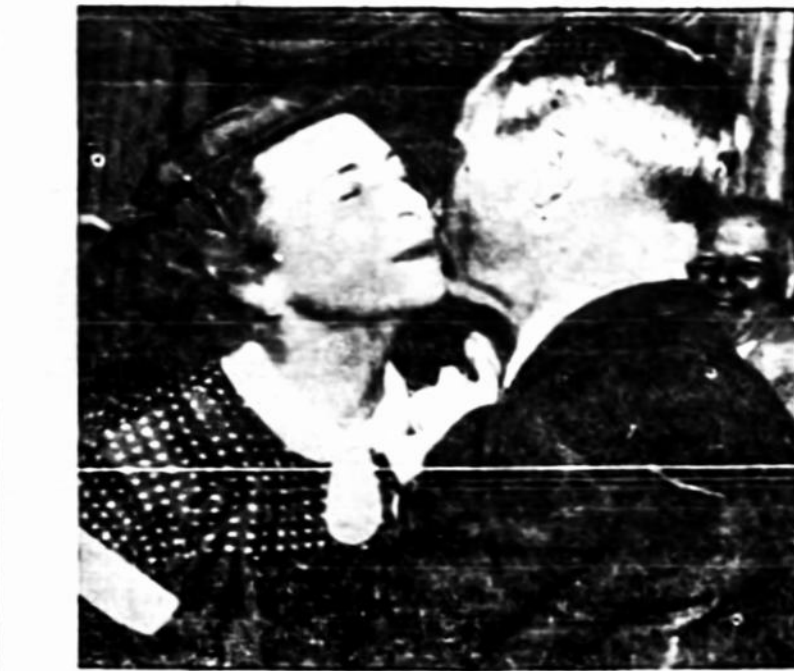
Naują oro karo jėgų sekretorių Donald Quarles po priesaikos pabušiavimu sveikina jo žmona.