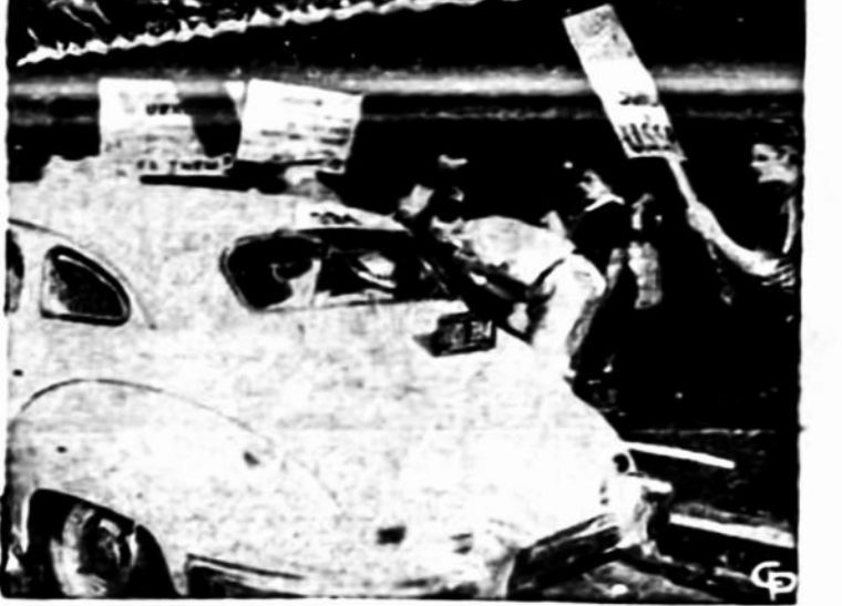
Antibolševikinio bloko žmonės piketuoja Chicagoje Sov. Rusijos „ūkininkų“ delegacija.

— JAV delegacija pranešė Genevoje vykstančias atominei konferencijai, kad prez. Eisenhoweris būtų patenkintas, jei būtų nutarta tokias konferencijas ruošti kas du ar trys metais.