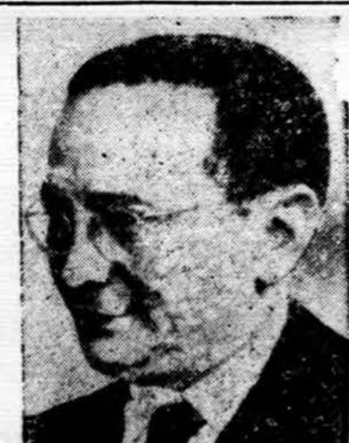
Joao Cafe Filho, pareigų atsisakęs ir vėl panorėjęs jas pasiimti Brazilijos prezidentas, kongreso prie jų nebeprileistas ir laikomas namų areštu.

Zenevos konferencijon nuklydęs Chruščevas pranešė, kad jos rezultatai buvo mikroskopiški.