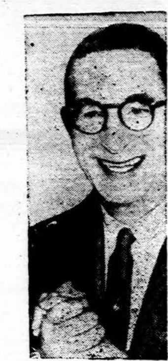
Senatorius Estes Kefauver (D. iš Tenn.) pareiškė spaudos atstovams Chicagoje, kad jis pranešė gruodžio 16 ar 17 d., ar jis kandidatuos į JAV prezidento postą.

Nedidelės yra lietuvių salelės Bradforde, Manchesteryje, Nottinghamame, o netgi pačiame Londone. Joks parengimas, joks pobūvis nesurbia tūkstančio. Tačiau ir mažesnių