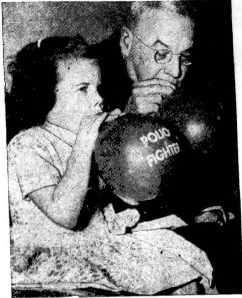
Valstybės sekretorius Foster Dulles padeda rinkti pinigų kovai su vaikiu paralyžiumi vesti.

— Vakariškai pranešta, kad Monaco princas Rainier veda kino filmų artistę Grace Kelly. Juodu susipažino prie Viduržemio jūros krantų, kai Kelly ten suko filmą.