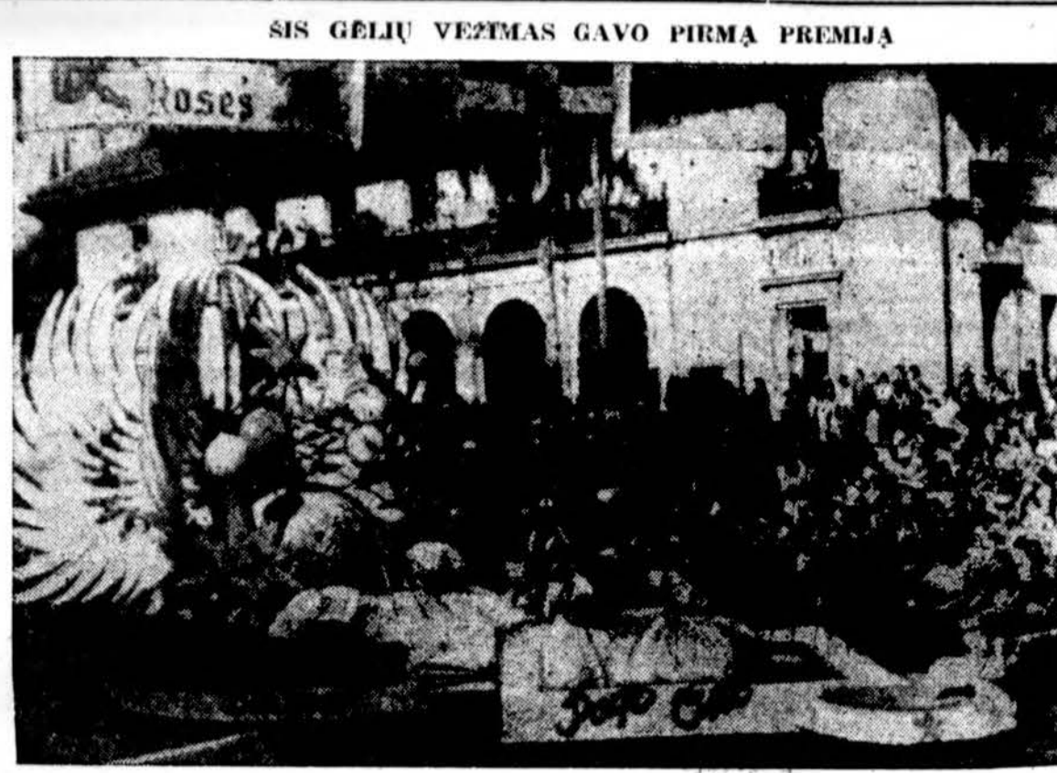
Burbank, Calif., gėlių vežimas gavo pirmąją premiją rožių festivalyje, kuris buvo sausio 2 d. Pasadenaje, Calif.

Esamos padėties trapumas rodo kokiuose klystkeliuose atsidūrė tarptautinės politikos vairotojai. Todėl ne be pagrindo rimti katalikai reiškia didelį susirūpinimą dėl pasaulyje vis didėjančios įtampos, kuri gali užsibaigti su viską naikinančia jėga arba kapituliacija prieš marksistų — komunistų užmojintą Rusiją.