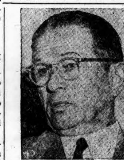
Sen. Ellender, senato žemės ūkio komisijos narys, apie kurį bus daug kalbama žemės ūkio reikalus svarstant. Jis gins demokratų nusistatymus. Prezidento pasiūlymą vakar įteikt.

Parlamentą renka 21 metų amžiaus piliečiai, turį sveiką protą. Naikinama diskriminacija, jei jos priežastis yra rasė, religija, kasta, lytis ar gimimo