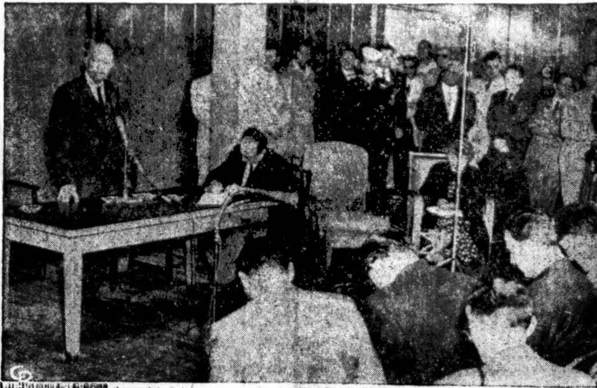
Pirmoji prezidento Eisenhowerio spaudos konferencija po širdies smūgio. Jis pasikvietė žurnalistus išvykdamas iš Floridos ir pasakė, kad pradėsias stipriai dirbti, bet dabar dar negalės pasakyti, ar galėsias kandidatuoti antram terminui.

— PJT džiaugiasi Jūsų pareiškimu, kad pavergtųjų tautų taikus išlaisvinimas yra ir pasilikta, kol bus pasiektas, JV užsienio politikos didysis uždavinys. Šio gyvenimo dalyko išryškėjimas yra dvigubai sveikintinas. Jis nieku pavers sovietų uolias pastangas įtikinti pavergtas tautas