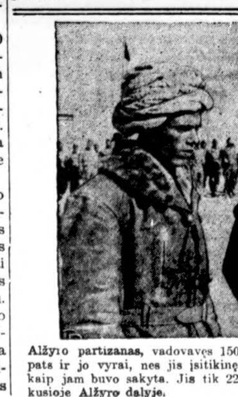
Alžyro partizanai, vadovavę 150 vyrų būriui, pasiduoja prancūzams pačs ir jo vyrai, nes jis įsitikinęs, kad prancūzai nėra tokie negerai, kaip jam buvo sakta. Jis tik 22 metų ir augęs kultūros dar nepasiekusioje Alžyre dalyje.

Jis dabar priminė, kad karui pasibaigus tuojau identifikavęs rusams Goebelo ir jo penkių vaikų lavonus, kurie buvo sudėti mediniuose karstuose miške netoli Berlyno. Septintas karstas buvęs uždarytas — jis mano, kad ten buvo Goebelo žmonos kūnas, bet rusai neprašė jos atpažinti.