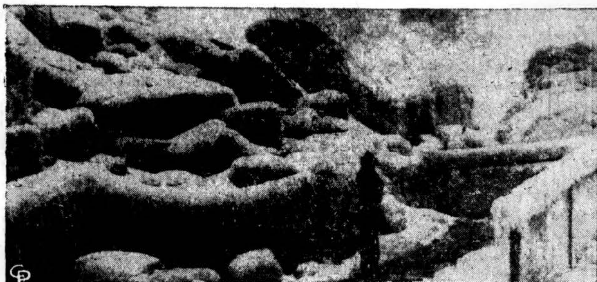
Taip dabar atrodo Niagaros krioklys ties Prospect Point stovint. Rytų pakrantėje pastaruoju laiku oras gana triukšmingas: ir sniega, ir lyja, ir šyla, ir audros siaučia. Floridoje vakar būta šalčio.