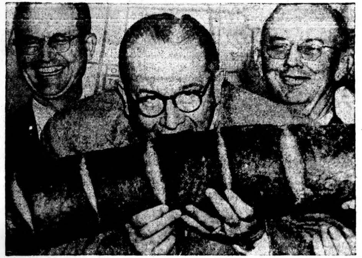
Argikultūros sekretorius Ezra Taft Benson, valgydamas duonos kepalą, parodė būdą sumažinti kviečių perteklių. Jis Washingtone tarėsi su kviečių gamintojų atstovais ir pareiškė jiems, jog "padėtis nėra entuziastiška". Jis pažadėjo viską daryti, kad "padėtis būtų geresnė".