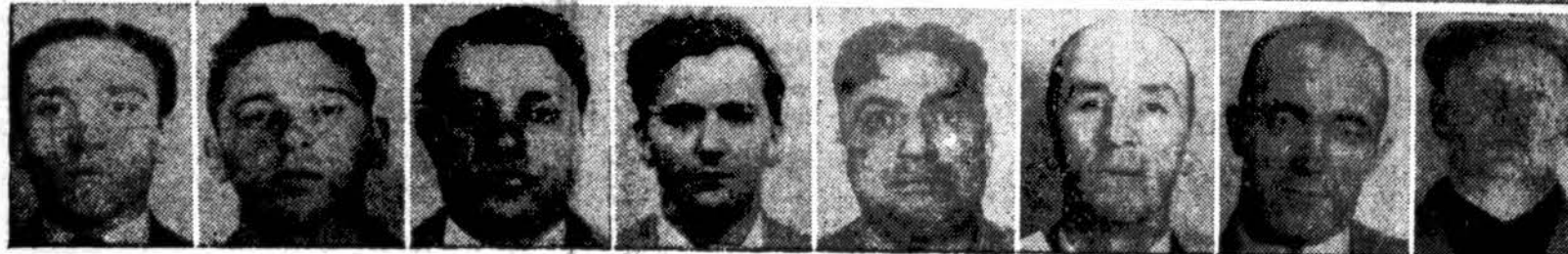
Išaiškintas brangiausias Amerikos istorijoje apipilėsimas. — Tai yra 1950 m. sausio 17 d. įvykęs Brink Express Co. Bostono skyriaus pinigų surinkimo centro apipilėsimas. FBI teigia, kad apipilėsimą vykdė 11 asmenų, iš kurių 8 yra jau policijos rankose, vienas miręs natūralia mirtimi, du žinomi, bet nesurasti. Plėšikai tada pagrobė 1,218,211 dol. pinigais ir 1,557,183 dol. čekiais ir kitokiais pinigais dokumentais. Grobis neatgautas. Šis vaizdas rodo plėšikų kelią ir jau policijos žinioje esančius plėšikus. (INS)