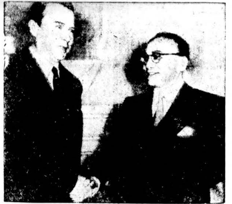
Sovietu Rusijos atstovas Jacob Malik (kairėje) ir Japonijos atstovas Shunichi Matsumoto sveikinais Londone vėl pradėjo tartis taikos reikalais.