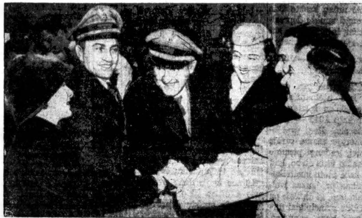
Kelieviai dėkoja lietuvo įgulos nariams, kad šie nelaimės metu laimingai "nutūpdė" lėktuvą New Yorko aerodrome.

tuvos Vyčių organizacijos su- važiavimuose (Chicagoje — 1950, New Yorke — 1951 ir Dayton, Ohio — 1952). Jis kuk- lus, tylus, bet jo žodis svarus, įtikinantis. Jo pasiūlymai švie- žūs, nauji. Lietuviškuose rei- kaluose aiškiausias, metas: žvil- genį j tolimesnę ateitį. Lakaus proto, lakios vaizduotės: žmo- gus, pokalbiuose ir diskusijose visa galva išskylęs iš kitų.