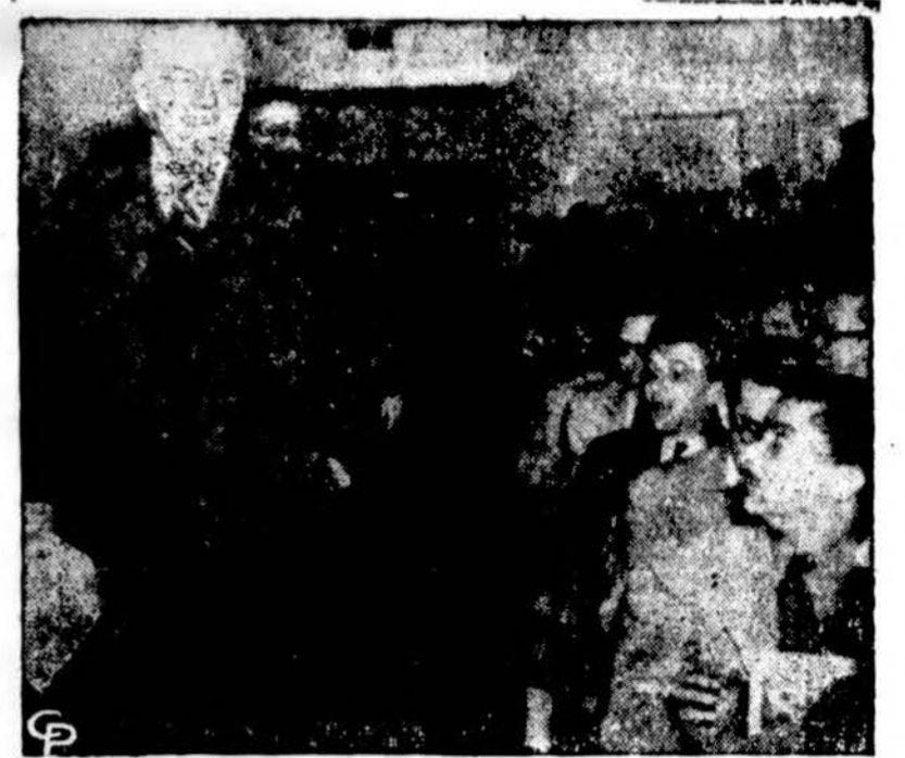
John Foster Dulles atvyksta į Valstybės departamento salę pasikalbėti su korespondentais aktualiais klausimais.

mas ir panašios aplinkybės vairuotojui nusikaltimą gali suvelninti arba net ir visai panaikinti.