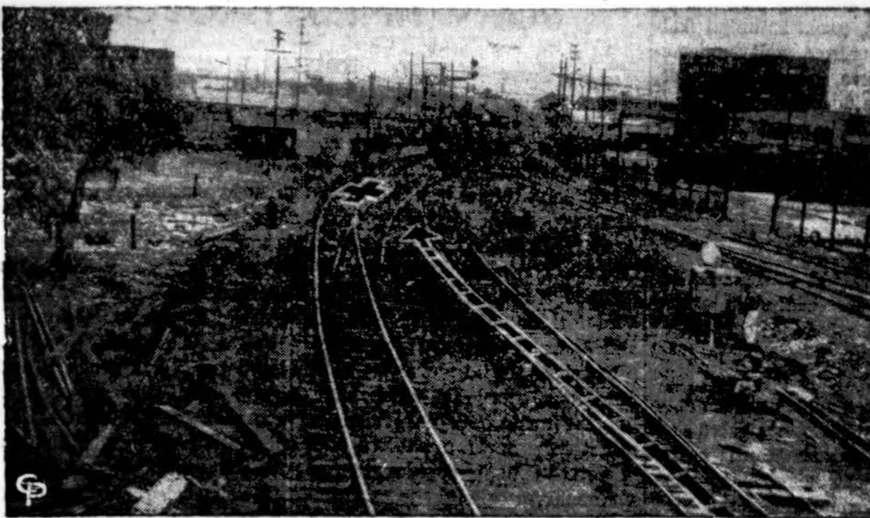
Taškai rodo kur Los Angeles traukinį ištiko baisi katastrofa.