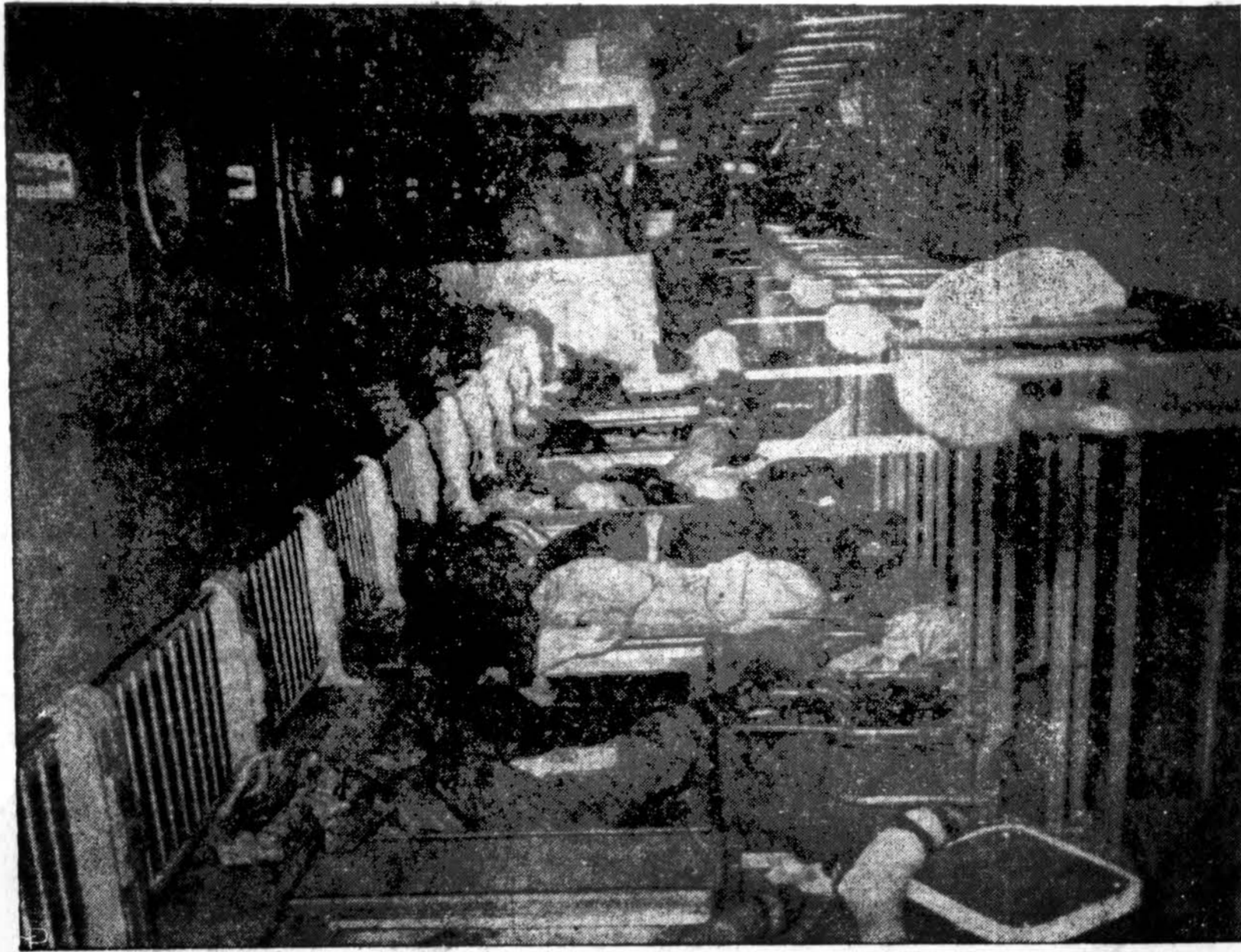
Vaidas iš Los Angeles įvykusios traukinio katastrofos. Iš dviejų vagonų ir garvežio susidėjęs traukinys pavirto ant šono prie staigaus pasukimo ir žuvo 29 asmenų, sužeisti 137. Nelaimė įvyko dėl greito važiavimo.

Sausio 25 d.: šv. Povilo atšventimas. Lietuviškas: Rimgaiva ir Mylė.