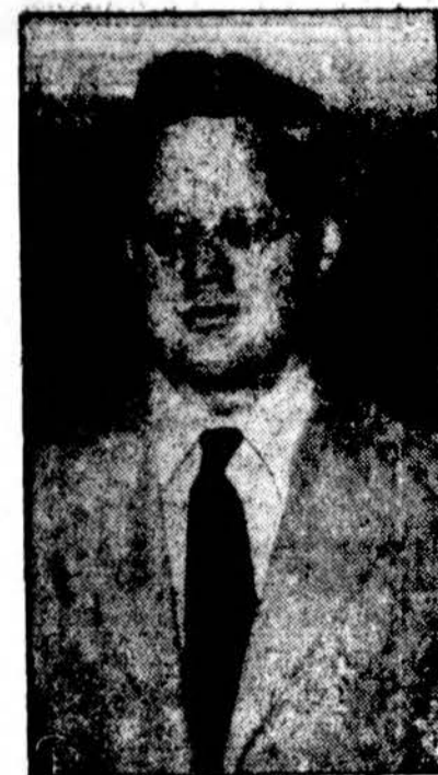
Robert Bowie Valstybės sekretorius Dulles nominavo sekretorium pagalbininku. Senate respublikonų vadai senatoriai William F. Knowland iš Kalifornijos ir Styles Bridges iš New Hampshire, nepatenkinti šiuo Dulles veiksmu.