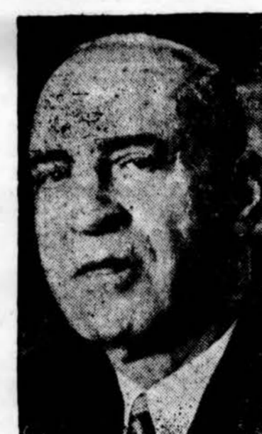
Sen. Lister Hill (D-Ala.) gaus The National Mental Health Committee pažymėjimą už auopelnus kovoje prieš protines ligas. Aukštinė statusėle vasario 10 d. bus įteikta Alabamos senatoriui Hill.

vas Patrick J. Hillings specialiai atvyks iš Washingtono ir kalbės Lietuvos nepriklausomybės atgavimo sukakties minėjimo iškilmėse š. m. vasario mėn. 18 d. Patriotic Hall patalpose. Tai pirmas įvykis Los Angeles lietuvių kolonijos istorijoje, nors ir praityje buvo daryta pastangų toki kalbėtoją gauti.