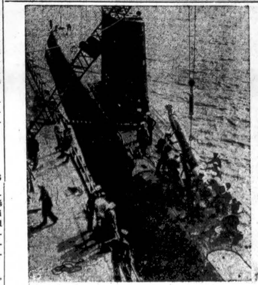
Atomines submarinas Nautilus pasiima torpedas New London, Conn., bazėje, pradėdamas antrus tarnybos metus Amerikos laivyne. Tai jam skirta gimtadienio dovana.

— Prancūzijos prezidentas Coty vakar pavadė socialistų atstovui Guy Mollet pabandyti sudaryti naują vyriausybę. Kompartija tuojuo pažadėjo paramą Mollet vyriausybei.