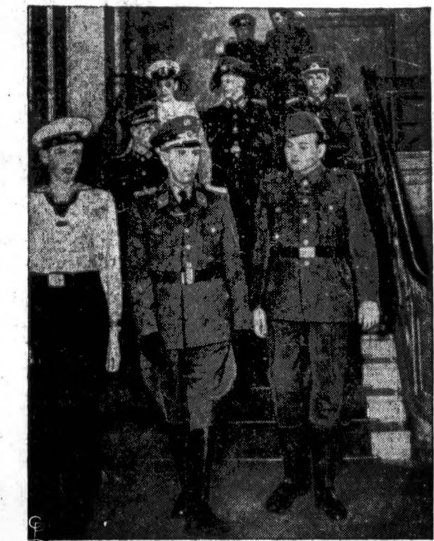
Taip atrodo sovietinės Vokietijos pėstininkų, jūrininkų ir lakūnų paradinės ir kasdieninės uniformos. Jų kirpimas ir spalva primena seniasis vokiškas uniformas, gi V. Vokietijos karių uniformos panašios amerikietiškomis. (INS)

• V. Vokietijos parlamentas paragintas paskubinti priimti karinių pajėgų organizavimo įstatymus.