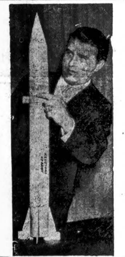
Dr. W. von Braun, vokiečių raketų ekspertas, skirias savo žinias ir talentą Amerikai ginkluoti. Jis čia matomas su savo raketos Redstone modeliu. Tai dar slaptas tebesąs Amerikos ginklas, pasiekęs bandymo stadiją.

Iš Jordano Hammarskjöld nuskrido į Libaną.