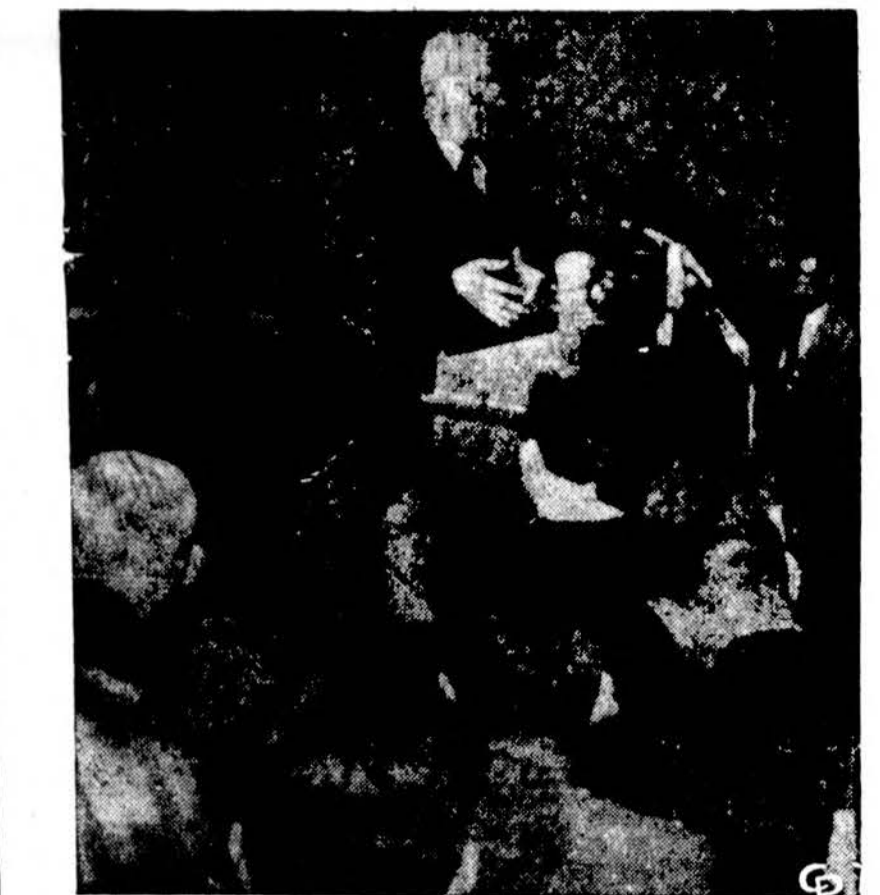
Valstybės sekretorius John Dulles kalba spaudos konferencijoje, įvykusioje Valstybės departamente. Jis pareiškė, kad administracija nori nepartinio bendradarbiavimo užsienio politikoje.

Paprasto reklamavimosi klausimas Visos bendruomenės turi žmonių, mėgstančių reklamą ir jos nemėgstančių. Besireklamuojančius ir besipiečiančius esame pratę laikyti karjeristais, jeigu jie tai daro ne dėl aplinkybėmis pristatinamų priežasčių. Tačiau turime ir su tuo skaitytis, kad kiekvienai visuomenei reikia priekį besiveržiančių ir vadovaujančių žmonių. Vienas bičiulis