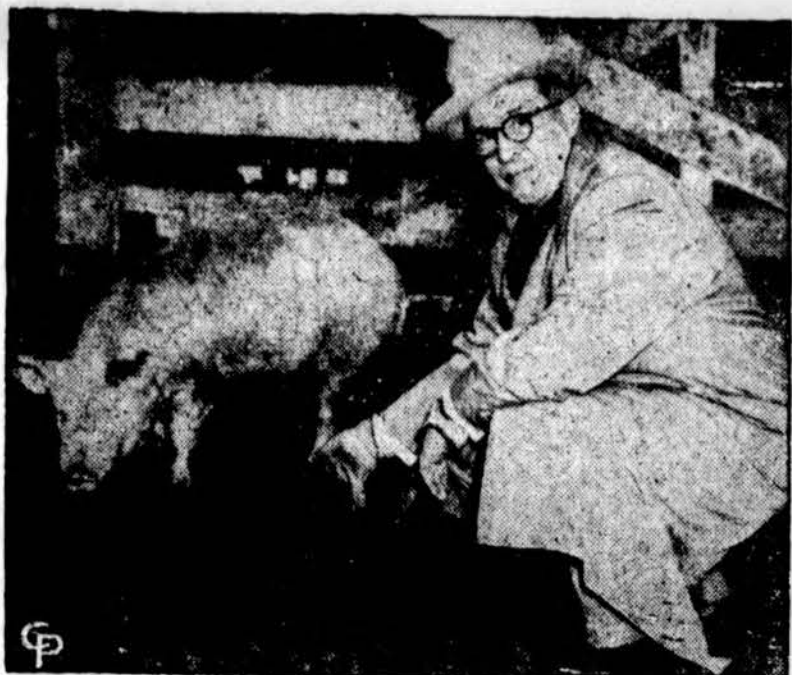
Chicagoje kalbėjęs National Swine Industry komiteto suvažiavime, Agrikultūros sekretorius Ezra Tatt Benson apžiūri paršą Chicagoos Steok Yards šerdyklose.