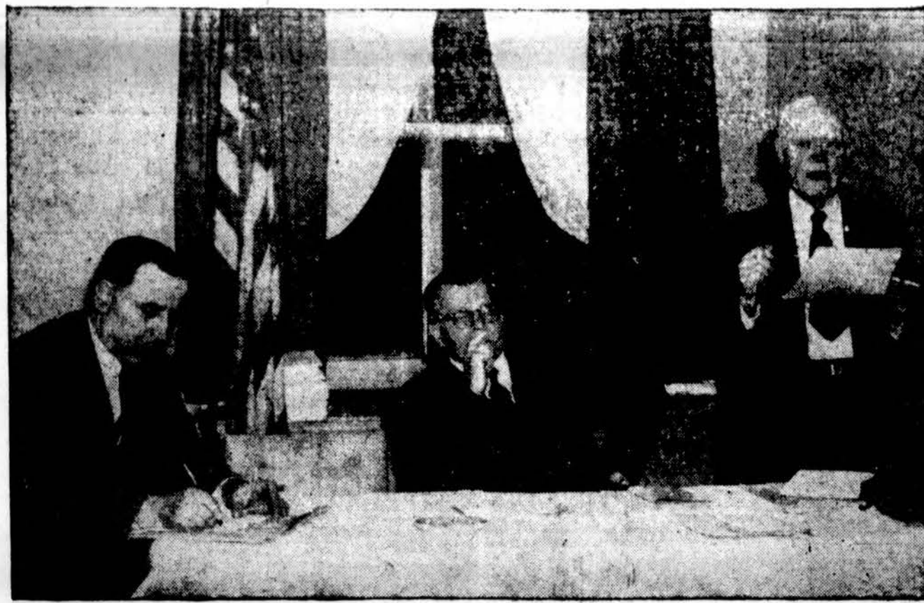
AIT' Vykdomojo Komiteto nariai yra pakviesti Vasario 16-tosios proga atvykti ir kalbėti įvairiose vietovėse rengiamuose minėjimuose. Jie lankėsi Washingtono, kur Lietuvos reikalais lankėsi Valstybės Departamente ir matėsi su eile vadovaujančių Kongreso narių.

"AF glaudžiai bendradarbiauja su Lietuvos Vyčiais. Jų paraginusi ateitininkus jungtis į L. Vyčių veikimą ir, kur sąlygos leidžia, artimai bendradarbiauti. Visuose L. Vyčių seimuose ir rajoniniuose seimeliuose AF buvo atstovaujama paties Federacijos vado ar jo pavesių žmonių. Atskiros sąjungos taip pat palaikė ryšius ir bendradarbiavo su joms artimomis organizacijomis. Bostone įvykęs ateitininkų ir vyčių pa-