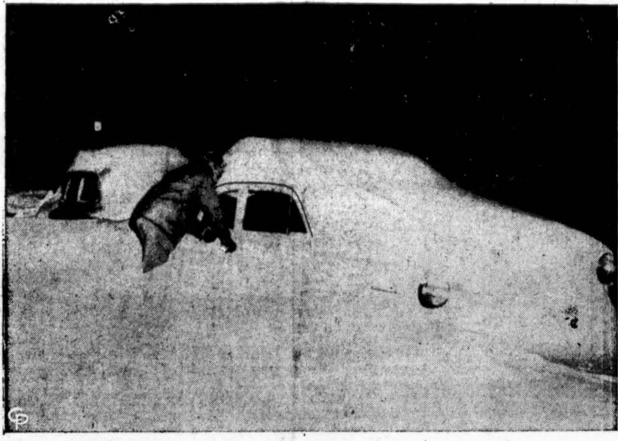
Žiema Texas valstybėje. — Gal kam ji ir nepatogi, bet ūkininkai džiaugiasi, kad žemė gaus daug vandens, kuris ten labai brangus. Tokios gausybės sniego ten nėra buvę per 50 metų.

● Famaugostos mieste Kipro saloje vidurinių mokyklų vaikai akmenimis ir stiklų šukėmis mėtė j britų kariams. Žinoma, jie tai padarė suaugusiųjų pakurstyti.